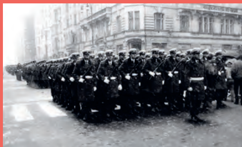
Fotografie z manifestace k Vítěznému únoru

Na to samozřejmě socialistický blok reagoval hlavně propagandou. Lid byl neustále očkovan v médiích zprávami, jak USA připravují válku, jaký je Reagan zločinec, Margaret Thatcher také. Na nástěnkách jste nacházeli nápisy: „Ne, pane Reagane!“ Kdyby tam bylo napsáno, že zemědělci sklidili z polí o 40 tun brambor více, mělo by to stejný dopad – žádný. Komunistické vládě nikdo nevěřil a jejich propagandě už vůbec ne.