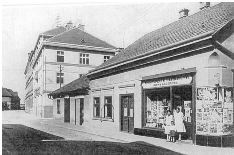
Maminka před naším knihkupectvím a papírnictvím.