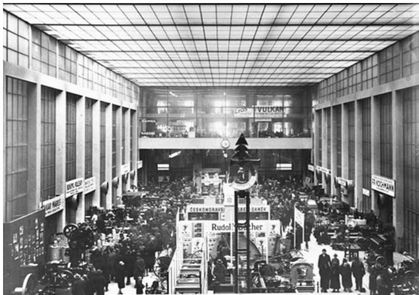
Obrázek 3 Veletržní Palác

V roce 1924 byl účelově postaven pražský Veletržní palác , který se stal ukázkou moderní konstruktivistické architektonické stavby v Evropě. Sloužil k pořádání pražských vzorkových veletrhů, na kterých se vystavovalo převážně spotřební zboží. Tyto výstavy trvaly až do roku 1951, kdy zanikají.