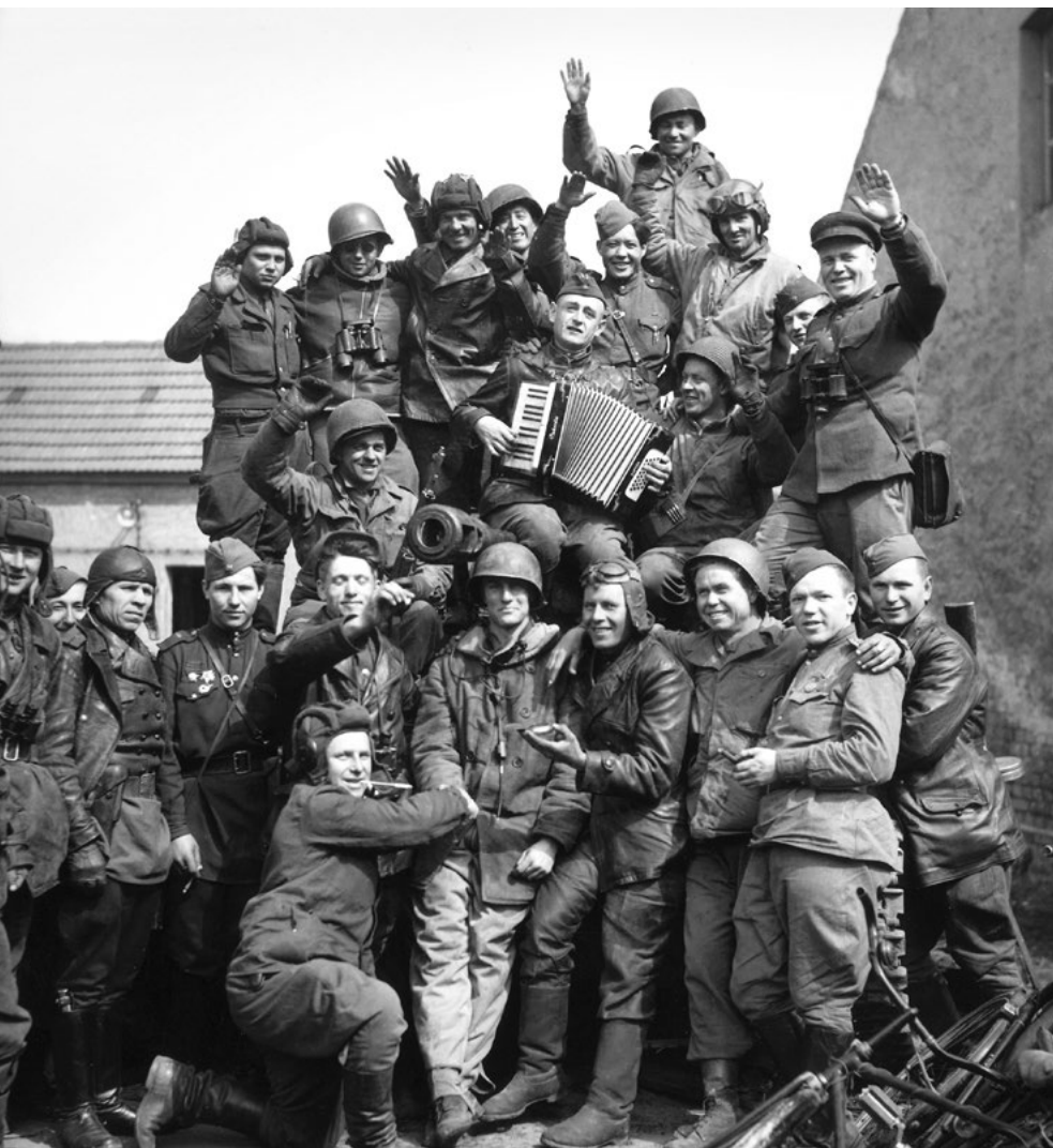
Americké a sovětské jednotky se druží po skončení druhé světové války v květnu 1945 v Sasku.