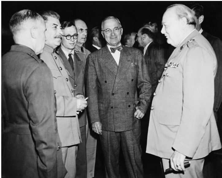
J. V. Stalin, americký prezident Harry Truman a Winston Churchill na Postupimské mírové konferenci v červenci 1945. „Kapitalismus a socialismus si nemohou porozumět, a proto je válka nevyhnutelná,“ prohlásil už 9. 2. 1946 v Moskvě Stalin.

Prezident Truman dal pokyn k vývoji ještě strašnější zbraně – vodíkové bomby. Národní bezpečnostní směrnice číslo 68, dokončená v dubnu 1950, však vykreslovala chmurný obraz. V roce 1954 by mohl mít SSSR asi 200 jaderných bomb. Proto musíme posílit naše pozemní, námořní a letecké síly tak, aby byly během dvou let zdvojnásobené! Rovněž Velká Británie a Francie zahájily zbrojení.