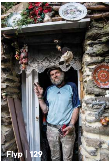
Flyp | 129