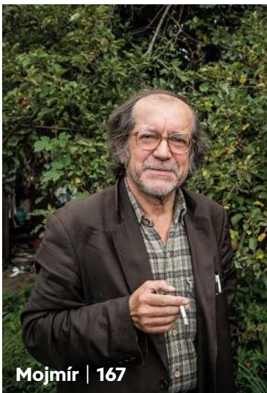
Mojmír | 167