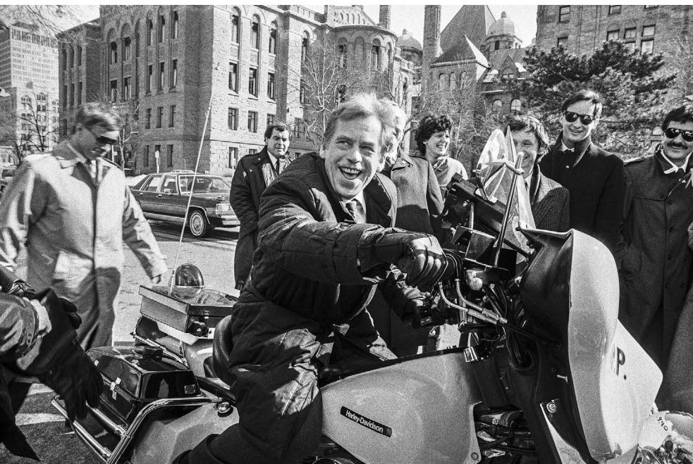
Václav Havel během legendární cesty do USA v únoru 1990

Rita Klímová, naše velvyslankyně v USA a první žena jmenovaná velvyslankyní v historii Československa, nastoupila do Washingtonu v lednu 1990 krátce před oficiální návštěvou