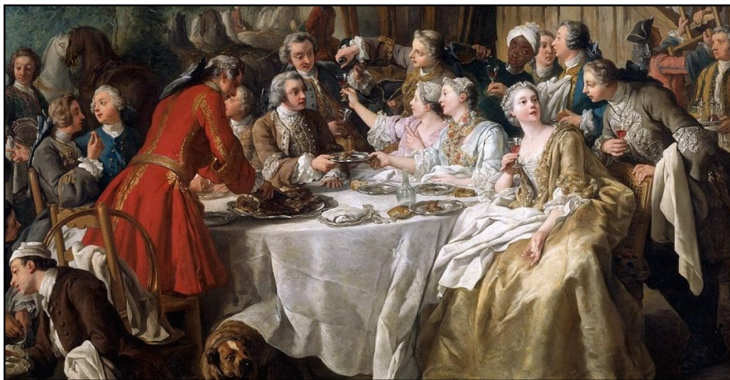
Hostina za časů Vatelů - François de Troy (1645-1730)

Kuchařské špičky zase se nám snaží vnutit, že máme být spokojeni, když na velkém talíři dostaneme vcelku malou porci, ovšem naservírovanou oproti duchu Vatelových barokních opulentních hostin v poněkud minimalistické formě, vyvážené všelikým uměleckým pocákáním volného prostoru na talíři.