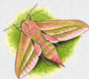
lišaj vrbkový 20