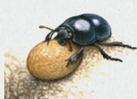
chrobák lesní 38