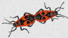
ruměnice pospolná 47