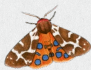
přástevník medvědí 21