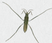
bruslařka obecná 45