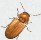
červotoč chlebový 36