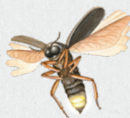
světluška menší 33