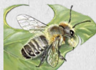
čalounice trouchová 54

Na posledních stránkách najdeš rovnokřídlé, škvory, rybenky, pavoukovce, stejnonožce a stonožkovce.