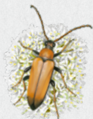
tesařík obecný 43