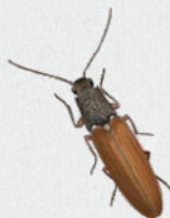
kovařík narudlý 31