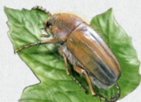
chroustek letní 39