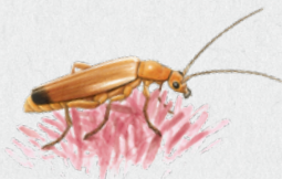
páteříček žlutý 34