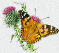
babočka bodláková 13