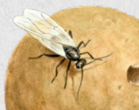
žlabatka dubová 52