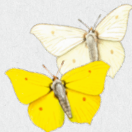
žlutásek řešetlákový 16