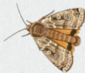
osenice šťovíková 22