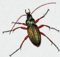
střevlík zlatý 29