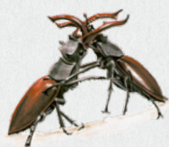
roháč obecný 41