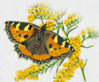
babočka kopřivová 11