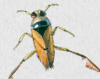
znakoplavka obecná 48