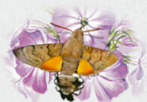
dlouhozobka svízelová 19