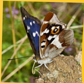
Velký batolec duhový doplňuje minerální látky

Motýlům nestačí k životu jen sladký nektar, potřebují i minerální látky. Proto sají například z vlhkých míst na zemi, která jsou na tyto látky bohatá. Na zahradě jim také můžeš přichystat kousky kamenné soli.