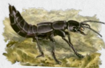
drabčík smrdutý 32