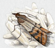
zavíječ paprikový 25