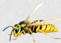
vosa útočná 51