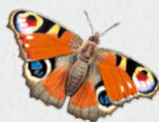
babočka paví oko 10