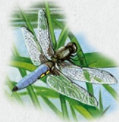
vážka ploská 27