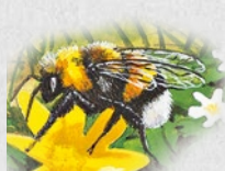
čmelák zahradní 53