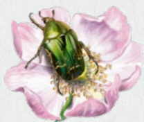
zlatohlávek zlatý 40