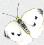
bělásek zelný 15