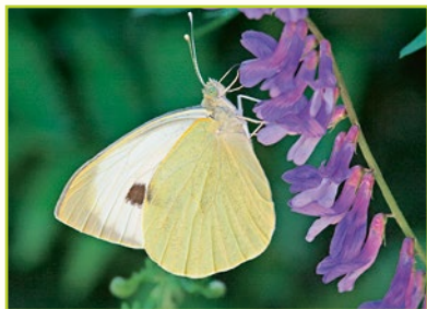
Samička běláška zelného saje nektar