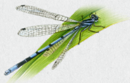
šídélko páskované 28