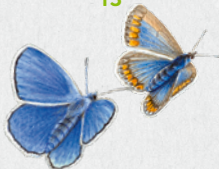
modrásek jehlicový 17