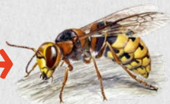
sršeň obecná 50