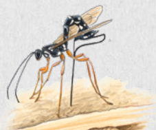
lumek veliký 49