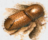
lýkožrout smrkový 42