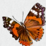
babočka admirál 12