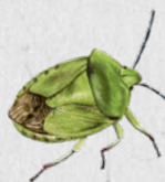
kněžice trávózelená 46

V této knize jsou živočichové seřazeni na základě genetické příbuznosti. Porovnej obrázky a urči správně druh.