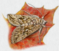
kovolesklec gama 24