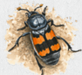
hrobařík obecný 37