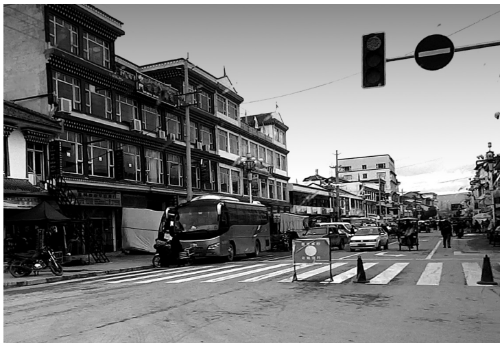
Centrum Ngawy, 2014

Tibet byl po staletí znám jako království poustevníků. Jeho kouzlo se skrývalo za přirozenou bariérou Himálaje a teokratickou vládou uzavřenou okolnímu světu, v jejímž čele se střídali dalajlamové, považovaní za převtělení svého bezprostředního předchůdce. Literatura devatenáctého a dvacátého století věnovaná Tibetu se hemží příběhy cizinců, kteří se pokusili proklouznout za hranice Tibetu v přestrojení za mnicha nebo poustevníka.