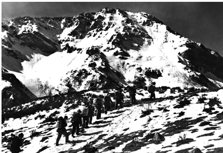
Čínská Rudá armáda míří na Tibetskou náhorní plošinu, cestou musí překonat horu Tia-tin-šan; červen 1935

Nic na této planetě nevypadá jako Tibetská náhorní plošina, unikátní geologický útvar, který se zvedá pět tisíc metrů nad mořem ze srdce Asie, vyneseny vzhůru stejnými tektonickými silami, které vytvářely himálajské pohoří. Ne náhodou se jí přezdívá střecha světa. Číňané se rádi chlubí, že je Velká čínská zeď vidět z vesmíru, ale když se podíváte na satelitní snímky Číny, na první pohled vás zaujme Tibet. Je to obrovská vnitrozemská plošina, lemovaná ledovcovými vrcholy nejvyšších hor světa jako bílými tahy štětce. Krajina je protkaná prameny velkých asijských řek, včetně Jang-c'-ťiangy,