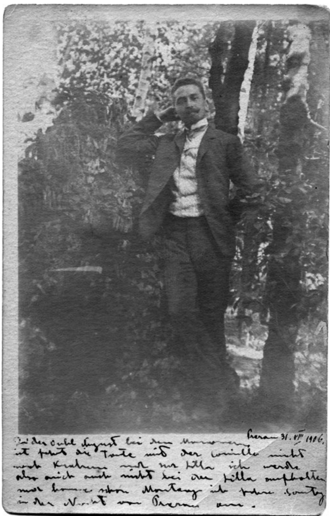
O studentu Lékařské fakulty Lvovské univerzity se říkalo: pohledný, elegantní, okouzující (Lvov, 1906).