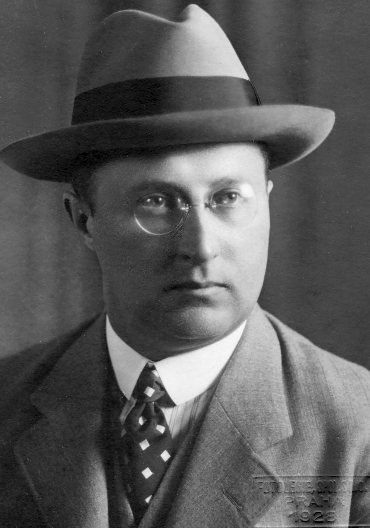
SPOLEČNOST PRAHA 1928