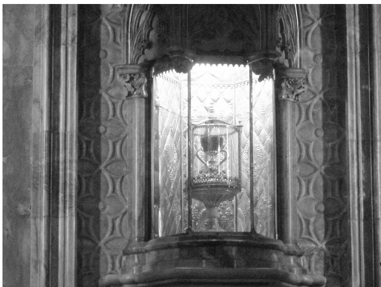
Za nejmáhodnější je považován svatý grál v katedrále Panny Marie ve Valencii