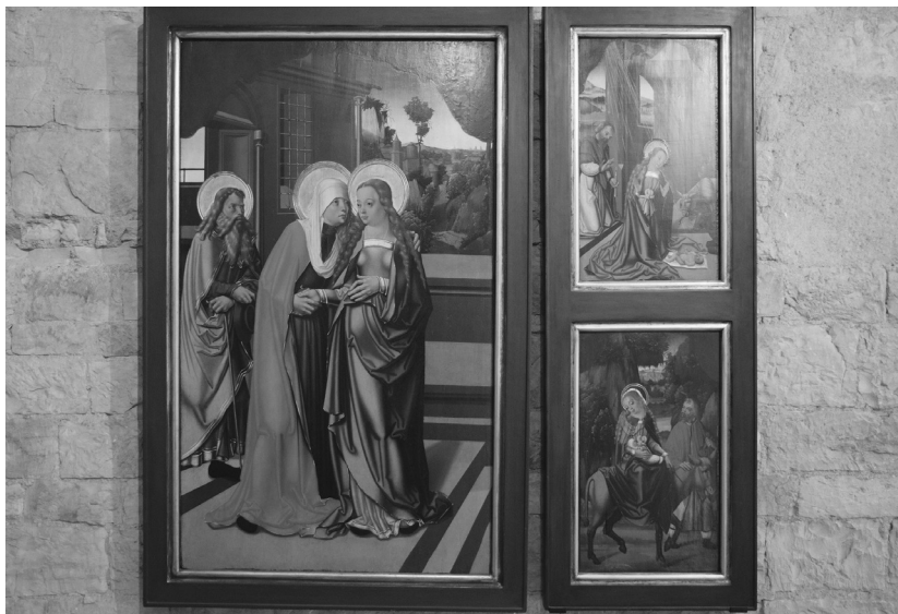
Mistr Litoměřického oltáře: Strahovský oltář (Navštívení Panny Marie, Narození Krista, Útěk do Egypta; kolem roku 1510, Strahovská obrazárna)

Pilátovi. Ten jej vinným neshledal a odmítl ho dát ukřižovat; pouze jej nechal zbičovat.