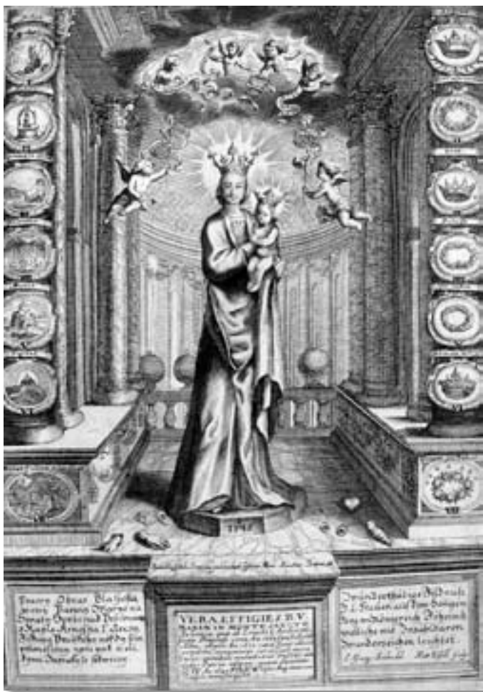
■ Obrázek 1 Panna Maria Svatohorská, u nohou jí leží obětiny, B. Balbin, Přepodivná Matka svatohorská , 1666

Na dnešního člověka mohou poněkud rozporuplně působit katolíkům dobře známé voskové obětiny. Šlo o drobné, duté, trojrozměrné voskové odlitky, které představovaly různé velké napodobeniny nemocných orgánů a končetin, lidských postav, zvířat, rostlin, staveb či věcí denní potřeby. Určeny byly především k prodeji poutníkům, kteří skrze ně žádali splnění prosby nebo vyjadřovali své díky tomu ze svatých, který byl v tom kterém místě předmětem kultu. Tak například mladá vdaná žena toužící po miminku vykonala pouf k místu, kde se uctíval některý ze svatých, a obětovala voskovou figurku děťátka v peřince, modlic se při tom za brzké početí. A naopak, šťastná rodička přicházela obětovat figurku miminka s díky za narození zdravého potomka.