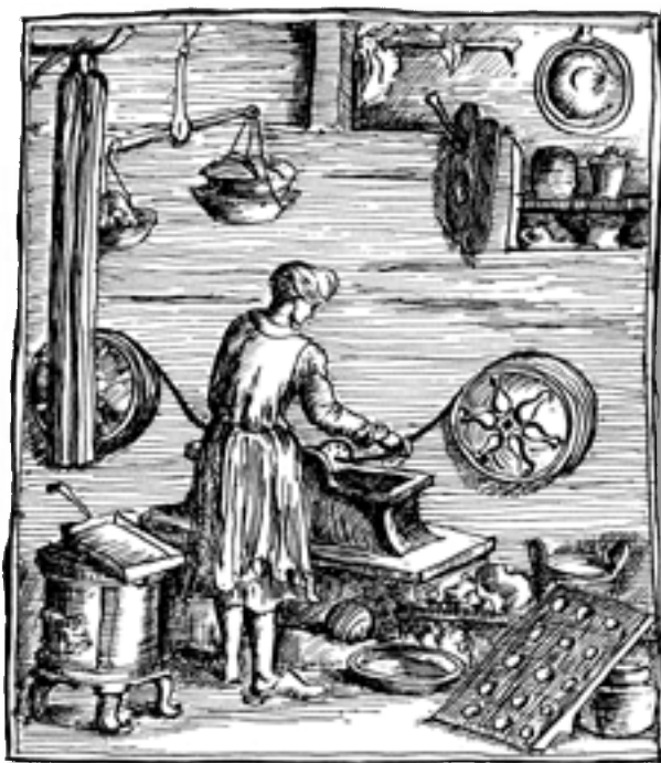
■ Obrázek 2 Voskař při výrobě svíček tažením, podle reprodukce rytiny z knihy Ch. Weigela Abbildungen der Gemein-Nützlichen Hauptstände , Regensburg 1698

Móda rokoka a biedermyera dokázala také využít. Ukázal se být vhodným materiálem pro tehdy velmi populární žánrové obrázky, portrétní medailony, drobné upomínkové a dekorativní předměty.