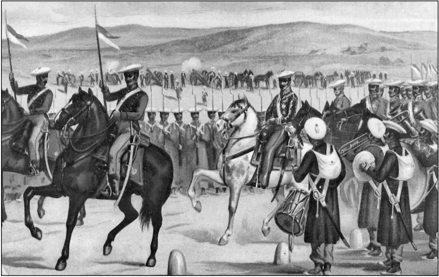
Don Carlos a slavnostní přehlídka karlistických vojsk v Amurrio

legitimistickým hnutím. Bez zmíněných Carlosů, Juanů, Jaimeů a Javiérů by pravděpodobně karlismus ani nevznikl, ani se nemohl vyvíjet. Jisté je jedno, i když je karlismus často historiky interpretován jako dynastické hnutí, nedílně spjaté s konfliktem ohledně nástupnictví na španělský trůn po smrti Ferdinanda VII., sociální, ideologické a politické kořeny karlismu jsou mnohem hlubší. Koneckonců dnes už i mnozí karlistič-