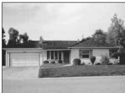
Dům Jobsových v Sunnyvale s garáží, kde se zrodil Apple