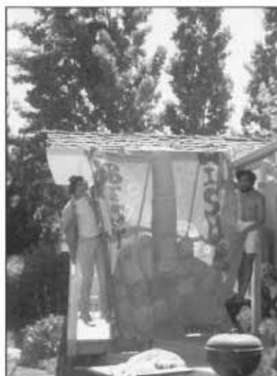
Školní žertík s podpisem autorů SWAB JOB