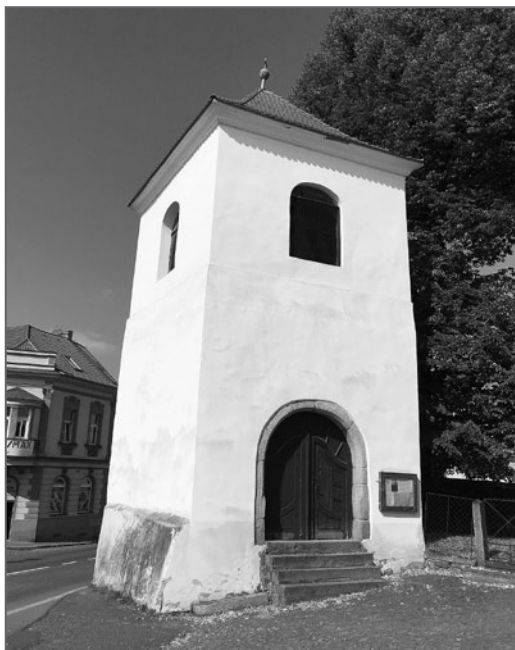
Předsunutá věž chrámu sloužícího jako pevnost: kostel sv. Martina v Sedlčanech

několika rotund, z nichž nejstarší tu stála už o století dřív. Vznikla tedy poměrně krátce po příchodu křesťanství do Čech a přitom na nápadném, bez přehánění strategickém místě, které nemělo význam ani tak z duchovního hlediska, jako spíš z obranného. Svatí otcové oněch časů zanechali pokyny, podle nichž je třeba stavět oltáře tam, kde předtím měli své bohy (nebo útočiště) pohané, ale je možné, že jen špatně pochopili, že pro pohany takový „chrám“ znamenal i útočiště. Anebo to pochopili dobře, protože rotundy nejspíš plnily stejnou funkci, jak napovídá síla jejich zdí.