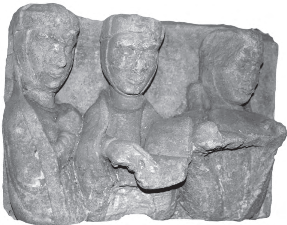
[4] Cisterciacký prišli do Marienthalu pravdepodobne ze slezské Třebnice. Reliéfni zobrazení jeptišek třebnického konventu. Třebnice, lapidárium kláštera.

Odkud jeptišky do Marienthalu přišly, není z pramenů známo. V úvahu přichází několik ústavů cisterciáček, s nimiž mohl být pražský královský dvůr v kontaktu. Na prvním místě lze uvažovat o slezské Třebnici, založené v roce 1202 vratislavskou kněžnou Hedvikou, manželkou knížete Jindřicha I. Klášter v Třebnici byl pražskému královskému dvoru dobře znám, neboť zde byla před rokem 1213 vychovávána Anežka, dcera Přemysla Otakara I., a v době, kdy se chystalo založení kláštera Marienthal, žila ve Slezsku další ze sester Václava I. Anna, manželka budoucího vratislavského knížete Jindřicha II. a snacha zakladatelky. 45 Pověst třebnického kláštera spolu s ohlasem zbožnos-