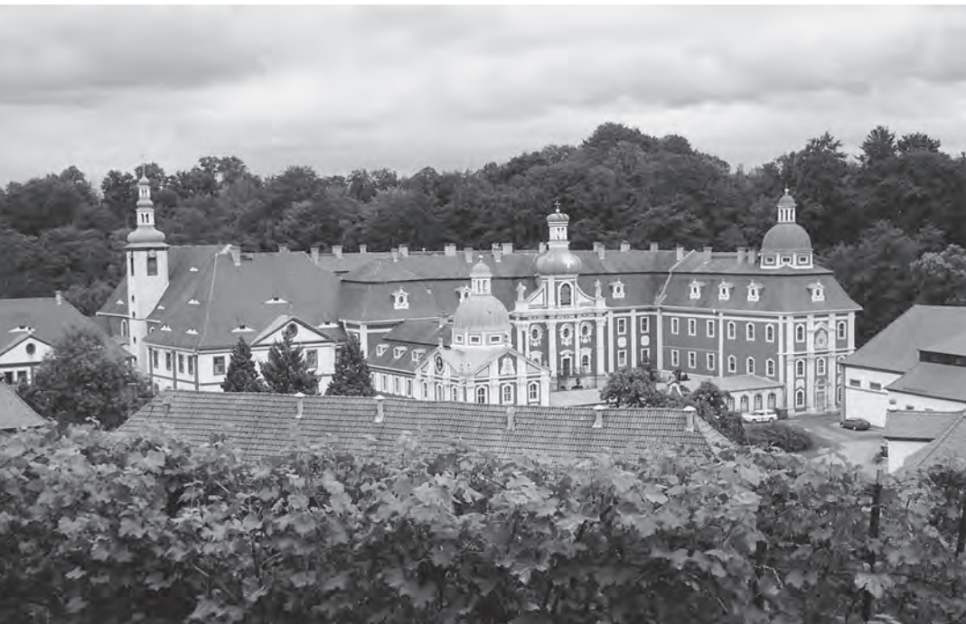
[1] Celkový pohled na klášter Marienthal. Barokní architektura dnes nepřipomíná jeho středověký původ.

hovat i na Šestiměstí. Pro odlišení obou částí získala Země šesti měst přídomek Lužice Horní, zatímco původní Lužice začala být zvána Lužicí Dolní. Jak již bylo řečeno, ve větší míře se tyto pojmy prosadily až během 16. století. 6