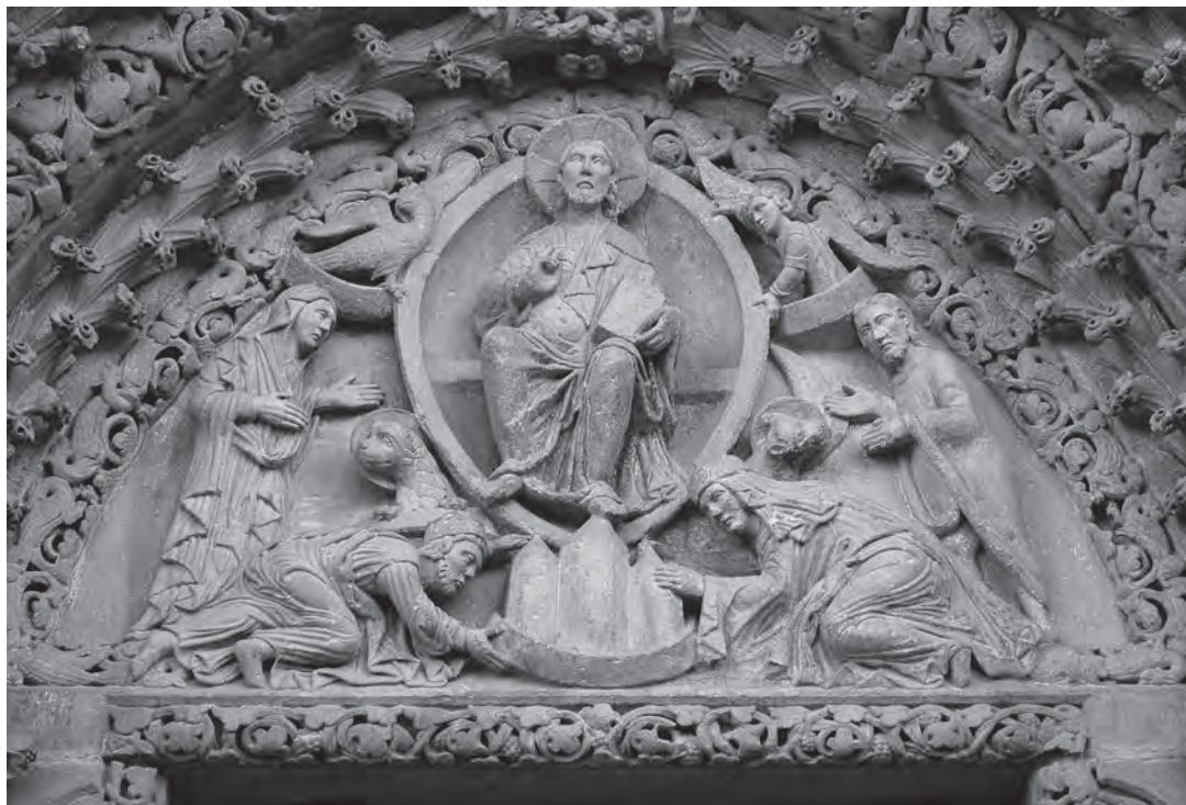
[2] Klášter cisterciáček Porta Coeli založila královna Konstancie Uherská, vdova po Přemyslu Otakarovi I. Splnila tím přání svého chotě, který před svou smrtí pro tento účel věnoval patřičný majetek. Bohatě zdobený portál zobrazuje královský pár jako zakladatele odevzdávající v pokorném gestu své dílo Kristu.

od samého počátku spjat s lokalitou Seifersdorf, darem královny Kunhuty. Na půdě této lokality jeptišky patrně od počátku sídlily a zdejší kostel také využívaly ke svým modlitbám. 37