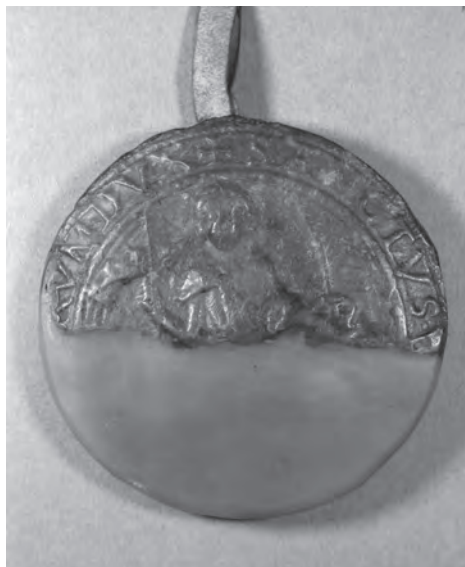
[7] Kroky Václava I. ve prospěch Marienthalu souvisely se zájmem českého krále o oblast Záhvozdu a Zhořelecka. Výřez z otisku pečeti Václava I.

ků, především za vlády Karla IV. a jeho nástupců, v době, kdy tato oblast opět připadla České koruně.