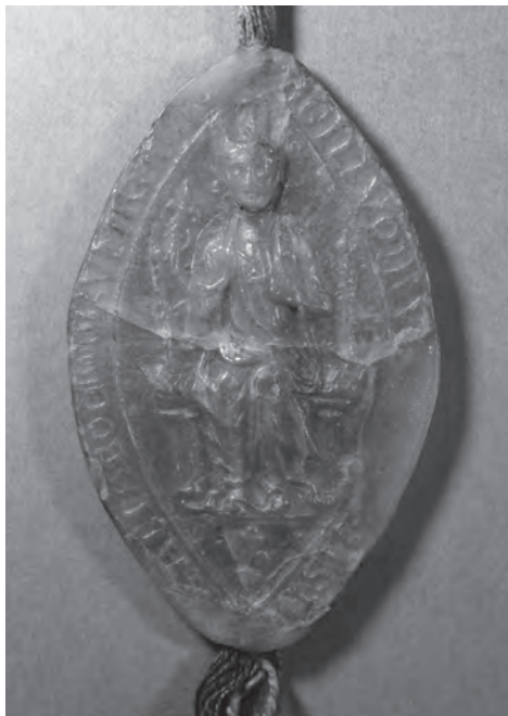
[3] Královna Kunhuta Štaufská, zakladatelka kláštera. Pečeť z roku 1247.

se někdy pokládá konfirmace kláštera královskými manželi Kunhutou a Václavem I. vydaná v roce 1238. 38 Vzhledem k tomu, že vydavatelem listiny není pouze královna, ale spolu s ní i její manžel, můžeme uvažovat o tom, že dokument plnil dvě funkce, a to jak zakládací listiny, vydané královnou, tak i její konfirmace panovníkem, který novou instituci navíc obdařil četnými privilegii.