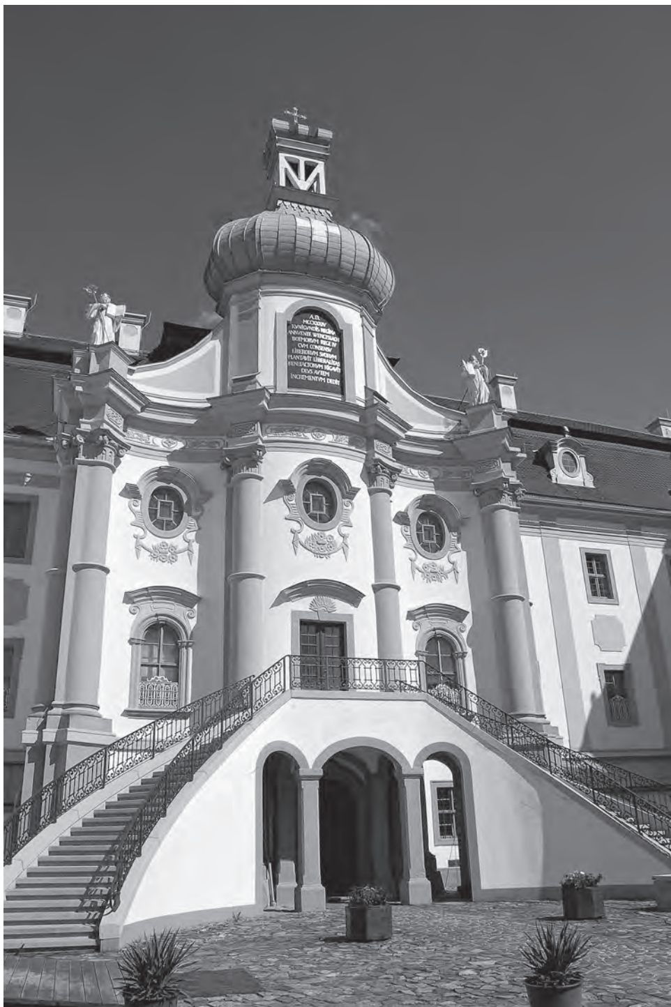
[5] Marienthal. Ústřední část současného kláštera.