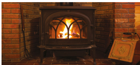
Kvalitní litinová krbová kamna Jotul

Účinnost spalování je velmi nízká – přibližně 15 %. Negativy jsou problémy s roztápěním, kouř unikající do místnosti, dehtování komína, minimum předaného tepla, žhavé uhlíky vystřelující do obytného prostoru, nutný komín o velkém průřezu. Výhoda je jen jedna, a to přímý kontakt s ohněm.