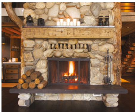
Modernizovaný otevřený krb

Většinou to dopadne tak, že se dozvíte, že kamna byla v rozporu s návodem provozována na vysokou teplotu, tedy přetápěna, a v tomto případě nárok na záruku zaniká.