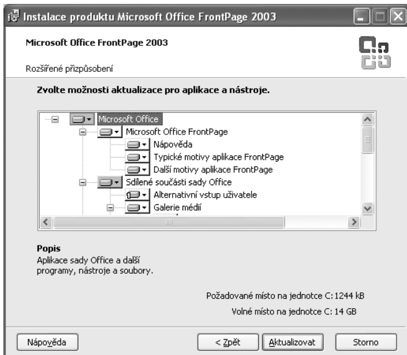
Obr. 1.2: Změna instalovaných komponent