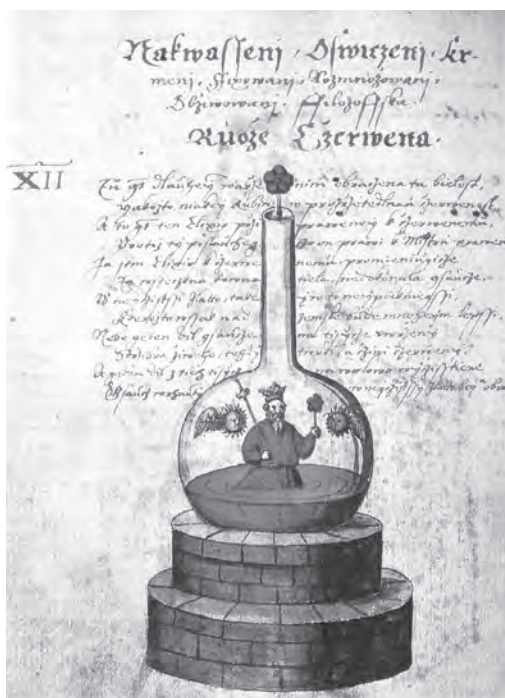
Ilustrace z alchymistického rukopisu

sařská laboratoř na Hradčanech zabírala dvě propojené místnosti v přízemí staré jednopatrové budovy, dříve používané jako přístřešek pro královské kočáry. Místnosti byly nahrubo vydlážděny, nerovná podlaha zůstala jako za starých časů, ale na jedné straně větší místnosti bylo postaveno několik komínů, v nichž se cihlové pece zbavovaly kouře a sazí.“