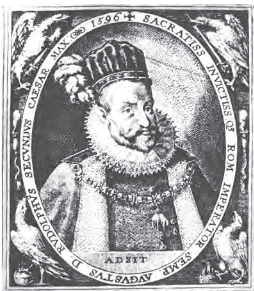
Císař Rudolf II. na mědirytině C. Passea podle obrazu J. Heintze

návaly deprese. Podobně na něj o rok později zapůsobila zpráva o chystaném sňatku jeho další bývalé potenciální nevěsty Marie Medicejské s francouzským králem Jindřichem IV. Císař zuřil a prý se dokonce pokusil o sebevraždu kordem.