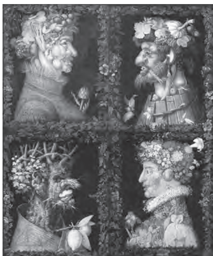
G. Arcimboldo: Čtvero ročních období

generální sněm zemí Koruny české rozhodl o tom, že se Rudolf musí vzdát českého trůnu ve prospěch svého bratra.