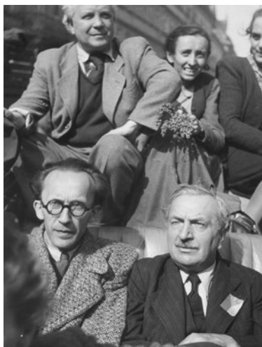
Václav Černý, fotografie z mládí.

Dne 9. května 1945, Václav Černý (s brýlemi) nedlouho po propuštění z německého vězení. Po jeho levici profesor Albert Pražák, nad ním František Halas.