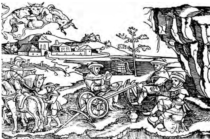
Přemysl snídající na pluhu. Ilustrace z původního vydání Hájkovy Kroniky české

jako vzácná relikvie ocitla v pražském Národním muzeu, sídlícím tehdy v ulici Na příkopě v místech nynější Živnobanky. Teprve později dospěli archeologové k závěru, že se nejedná o Přemyslovu otku, ale o keltskou železnou sekyrku, tedy předmět konec konců mnohem starší, byť nikoliv posvátný.