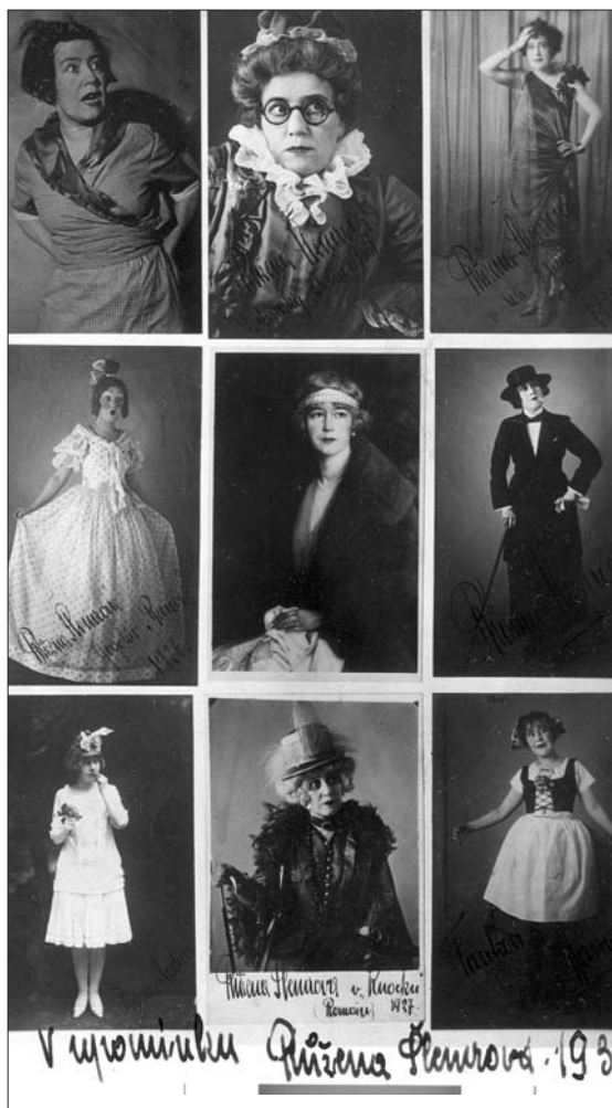
Souborná, vlastnoručně podepsaná fotografie, mapující pestrý repertoár osobité herečky.

Chtěli-li bychom pro začátek alespoň zčásti důvěřovat astrologickým rozborům znamení, které dávají do vínku jednotlivým zástupcům zvěrokruhu