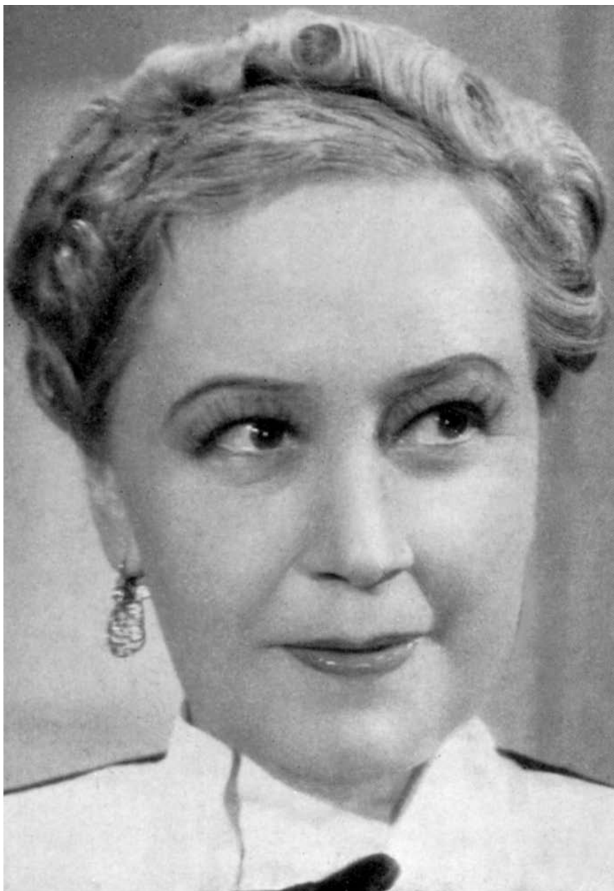
Vždy šarmantní umělkyně Růžena Šlemrová.