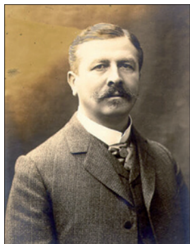
Obr. 2.1. Joseph Francois Felix Babinski, francouzský lékař (1857–1932). Jeho bibliografie je rozsáhlá. Začíná pojednáním o tyfové horečce (1882) a končí studií hysterie (1930). Babinski pracoval s velikány francouzské neurologie Charcotem, Brissaudem, Pिरerrem Marie či Déjerinem. V roce 1903 popsal příznak vějíře prstů dolní končetiny. Publikoval také texty o cerebrospinální syfilidě, mozečkových příznacích a symptomech jako je asynergie, adiodochokineze, adipozogenitální dystrofie nebo unilaterální bulbární léze

v čase. Somatické, neurologické a psychiatrické vyšetření může pomoci k určení pravděpodobné diagnózy. Nedílnou součástí je i orientační vyšetření neuropsychologické. K potvrzení nebo vyvrácení pracovní diagnózy používáme doplňková vyšetření včetně objektivní anamnézy, podrobného vyšetření klinickým psychologem a zobrazovacích metod. V případě diagnostických nejasností může být přínosné pacienta pozorovat v průběhu krátké hospitalizace.