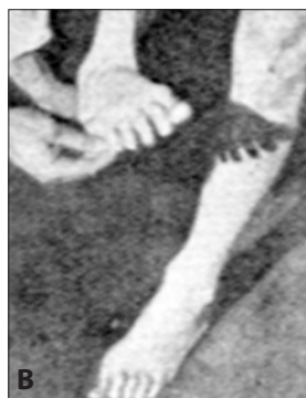
Obr. 2.2A, B. Babinskiho příznak