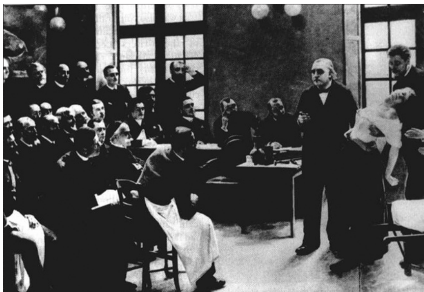
Obr. 1.1. Obraz francouzského malíře A. Brouilleta Klinická přednáška v Salpêtrière , zachycující Charcota a další významné neurology a psychiatry