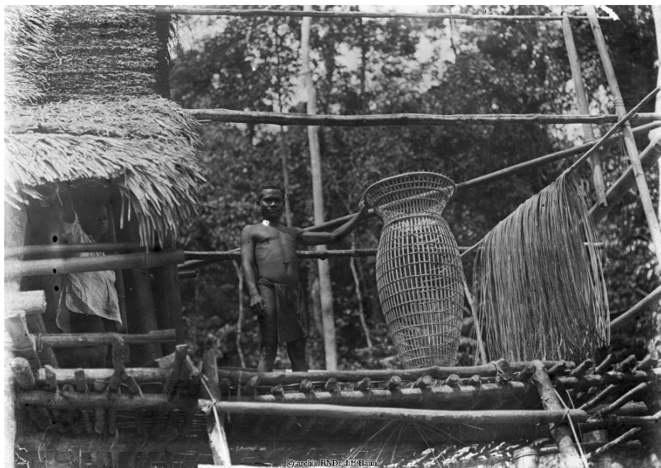
Domorodec kmene Semangů s vrší na ryby, zadní Indie

Moře v okolí korálových ostrovů jižních moří je za pěkné pohody sytě modré, ale lahvově zelené pásmo kolem břehu naznačuje poměrně mělkou vodu, chráněnou před příbojem přirozenou hradbou korálových balvanů. Tato část moře, od míst, kde se tříští bílá pěna příboje, až k oslnivě bílému písku břehu, vroubeného kokosovými palmami, je útočištěm bohaté zvěřeny a rájem rybářovým. Chytání ryb u nás má se k rybolovu v těchto končinách