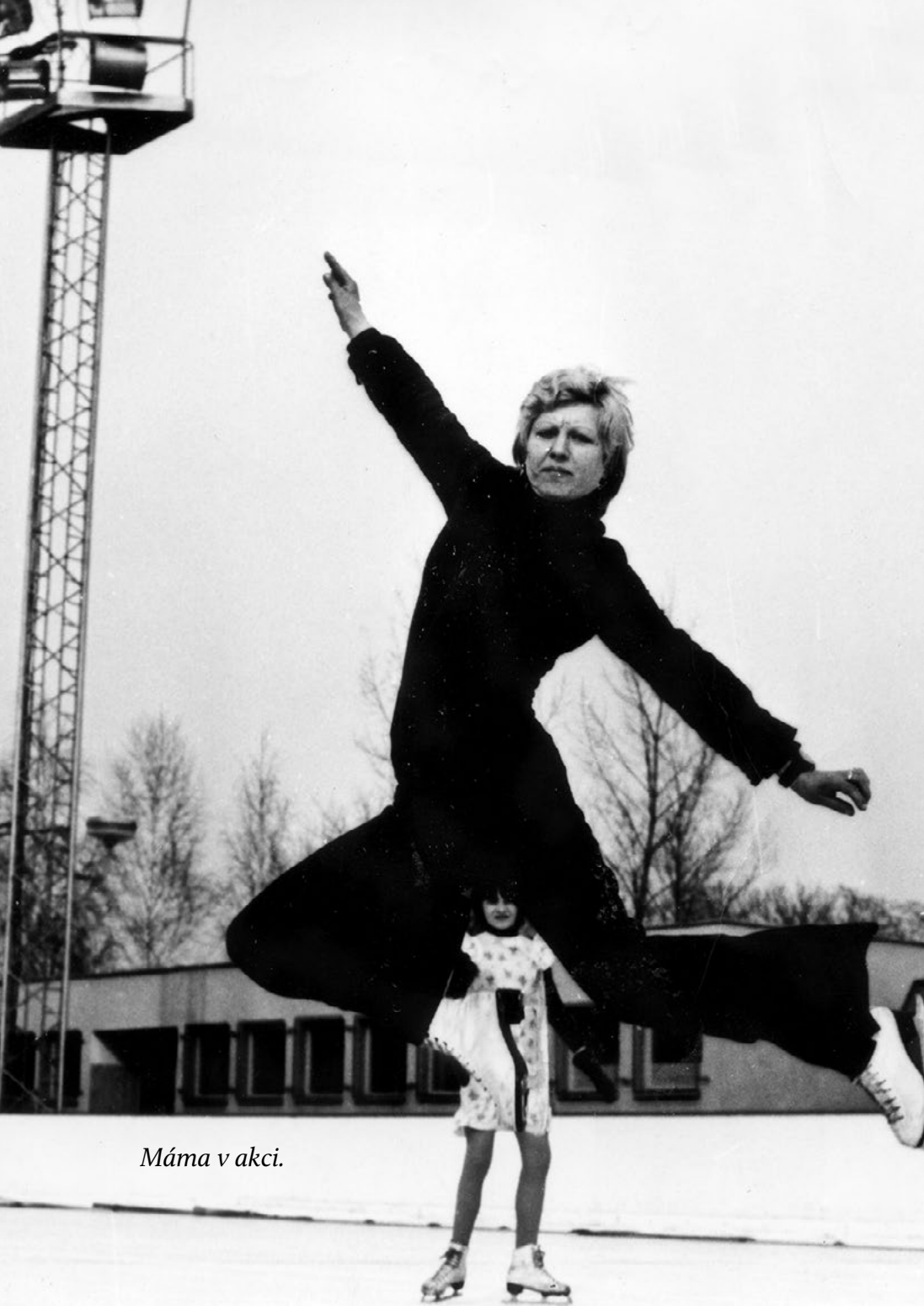
Máma v akci.