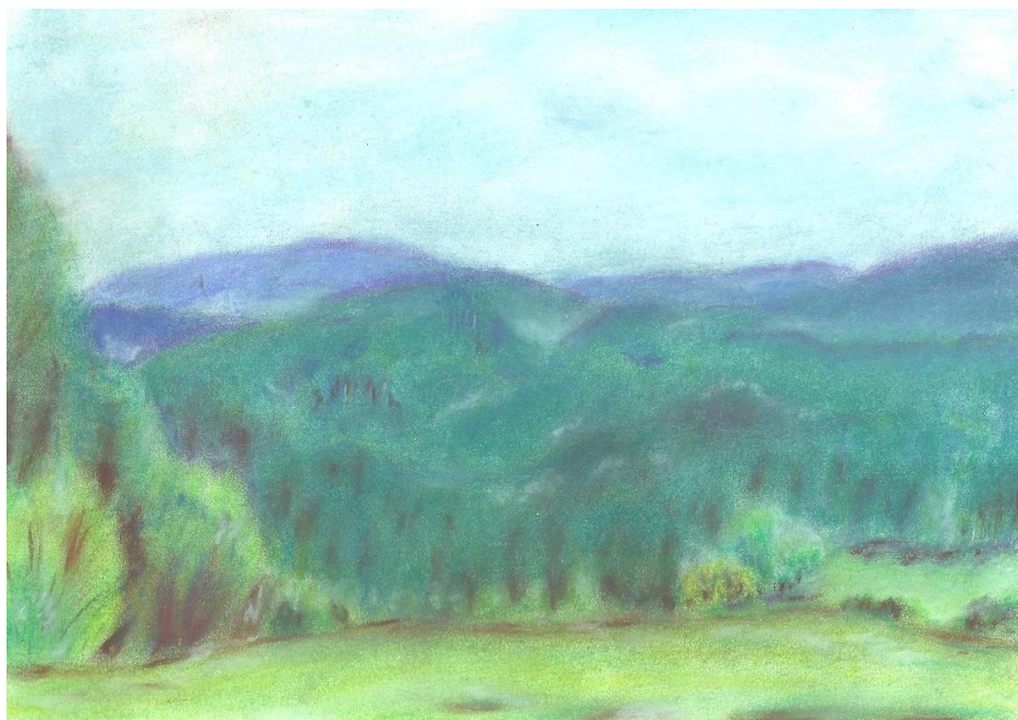
Okno do Šumavy

Krásné je být v tu chvíli na Šumavě. A když nad krajem zavládne hluboká šumavská noc, na nebi plují hvězdy a měsíc se zdá být skoro na dosah ruky, je čas na tu nejkrásnější pohádku, kterou napsal sám život. Pohádku o zálesákovi a víle.