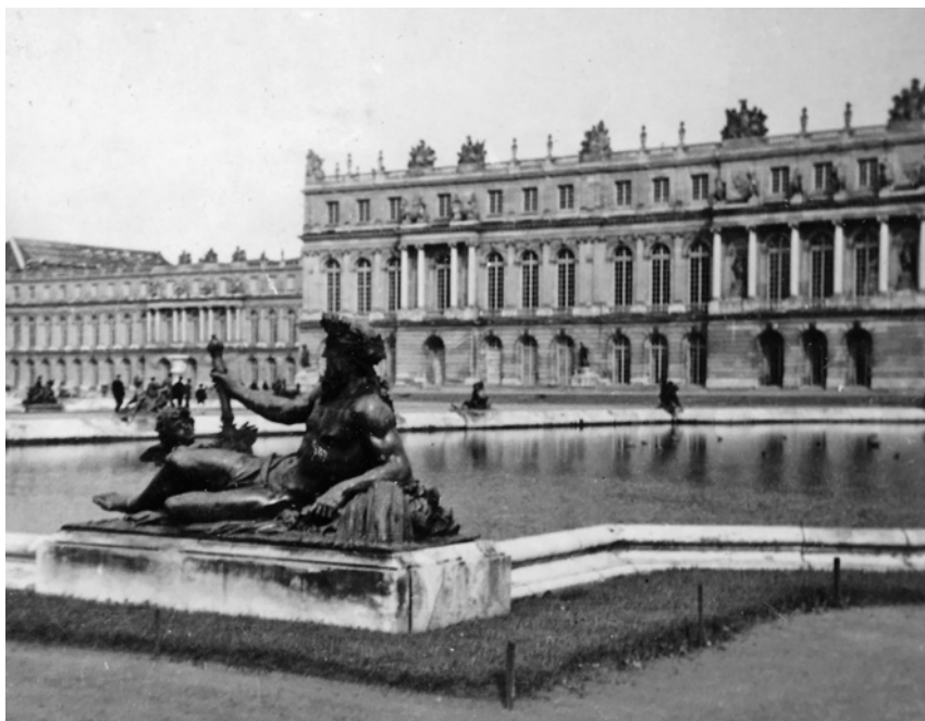
Slavné Versailles na snímku Oldřicha Hořejšího (VÚA-VHA Praha).

britskými úřady za enemy alien , řídil sanitku a následně se dobrovolně přihlásil do čs. vojska. 73