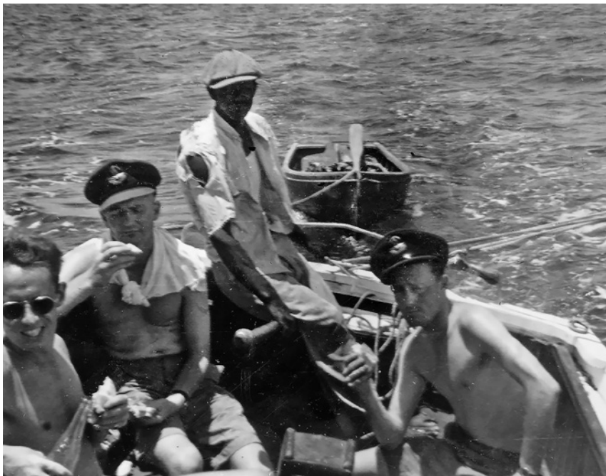
... takže hladová břicha zasytil sendvič, ovoce a Coca-Cola (VÚA-VHA Praha).

a Vild přiznával, že ignorovali veškeré nápisy, že se jedná o soukromý majetek. 137 Stejně překvapení (možná přímo odpor) jako s houbami u Angličanů vzbuzovala záliba v sádle: „Angličanům sloužilo výhradně pro pečení nebo smažení, říkali mu cooking fat, když nás viděli, jak si jím mažeme chleba, padali do mdlob.“ 138