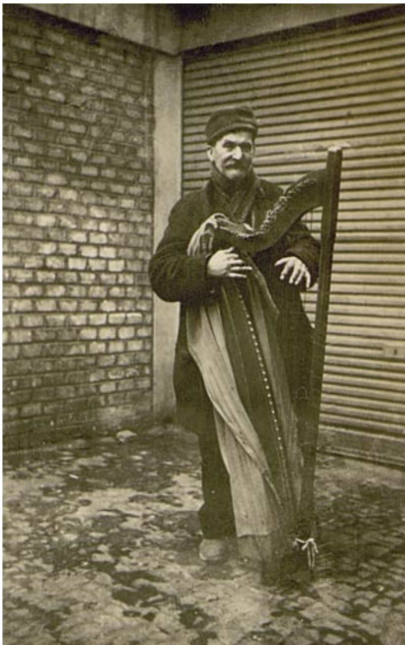
Lidový harfeník , počátek 20. století, pozůstalost Marie Zunové, př. č. Sp 80 /61 Folk harp player , early 20 th century, estate of Marie Zunová, acquisition no. Sp 80 /61

V neposlední řadě patří upřímné díky řediteli Českého muzea hudby, Emanuelu Gadaletovi za jeho cennou pracovní i osobní podporu vědeckovýzkumného projektu.