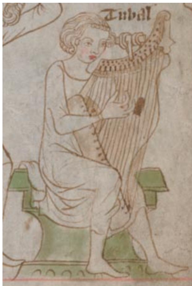
Žaltářová harfa , detail z Velislavovy bible, kolem 1340, Praha, Národní knihovna XXIII. C. 124, fol. 7r Psalterium harp , detail from the Velislav Bible (Velislav biblia picta), ca. 1340, Praha, Národní knihovna XXIII. C. 124, fol. 7r

Od 40. let 18. století se objevují záznamy o tom, že do Karlových Varů jezdili potulní harfeníci, aby bavili tamní lázeňské hosty. Svou hrou na harfu vynikal například rodák z Mostu v severních Čechách a budoucí hudební skladatel Florian Leopold Gassmann (1729–1774). Údajně si tímto způsobem přivydělal v Karlových Varech větší finanční obnos, aby pak zamířil do Itálie. 25