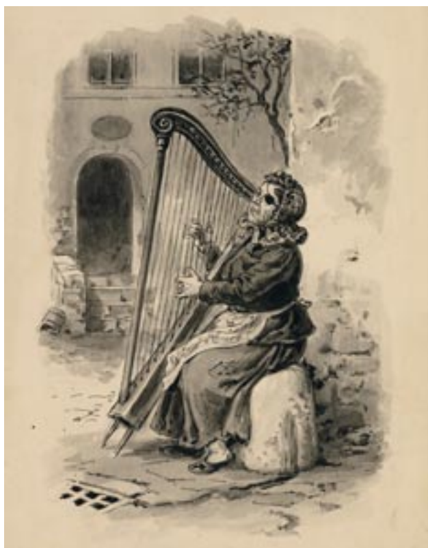
Dobové vyobrazení potulné harfenice, akvarel A. Gareis, 19. století, inv. č. F 2204

Period illustration of a woman as a wandering harp player, watercolour, A. Gareis, 19 th century, inv. no. F 2204