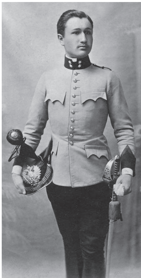
Nejmladší dragounský poručík v rakouské armádě. Nedatováno.