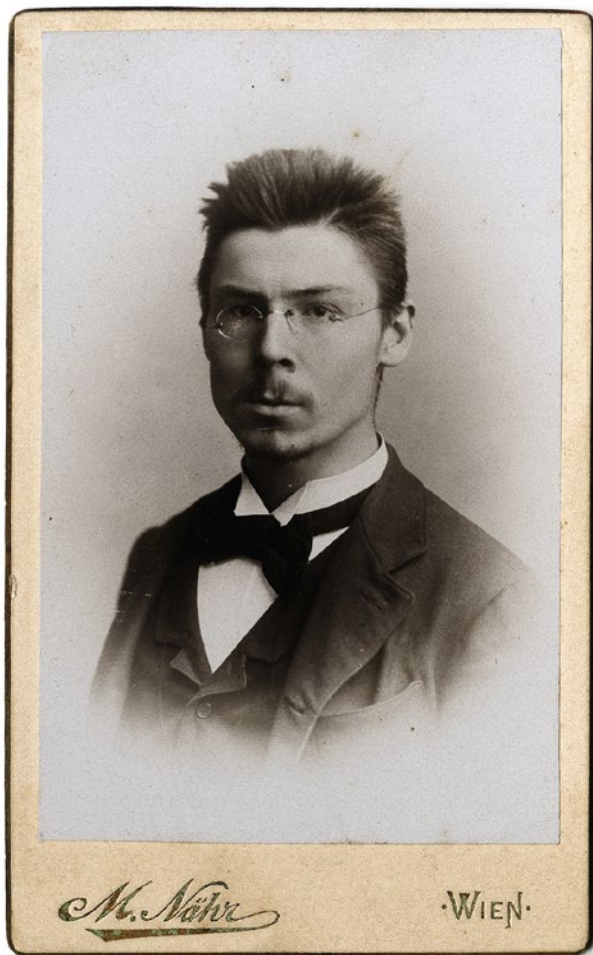
Jože Plečnik, Vídeň 1892

Málokterý cizinec zanechal po sobě v českých zemích tak výraznou a trvanlivou stopu duchovní i materiální, jako se to podařilo slovinskému architektovi Josipu Jožemu Plečnikovi. (Budeme v dalším textu používat křestní jméno ve tvaru Jože, nikoliv v byvší Jugoslávii prosazované Josip. A navíc maminka Jožemu říkala Pepe – jak je vidět, oficiální i domácké varianty křestního jména nejsou našemu prostředí vzdálené, resp. jsou si velmi blízké.) V jeho případě jsou onen