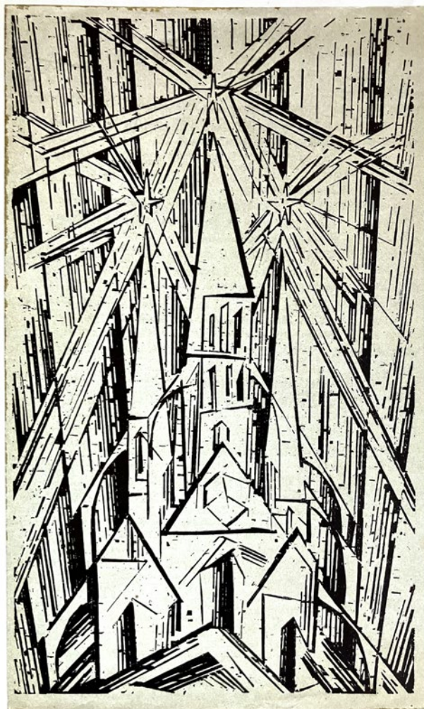
Lyonel Feininger – Cathedral, dřevoryt, 1919

Plečnik svým mísením historických stylů a jejich moderním adaptováním do celků staveb (a v případě Lublaně i Prahy do urbanistického celku) musel historikům činit problém, takže například do obrazového průvodce Owena Hopkinse Architektonické slohy (Grada, Praha 2017) se jeho jméno nevešlo vůbec. To by ovšem pravděpodobně zralému Plečnikovi žádnou vnitřní újmu nezpůsobilo. Už v době studií u Wagnera totiž souzněl s teorií Gottfrieda Sempera (1803–1879), německého architekta, autora drážďanské opery nebo vídeňského Burgtheatru, o tom, že lépe než se držet nějakého vymezení stylu je zaměřit se na principy konvence a vkusu.