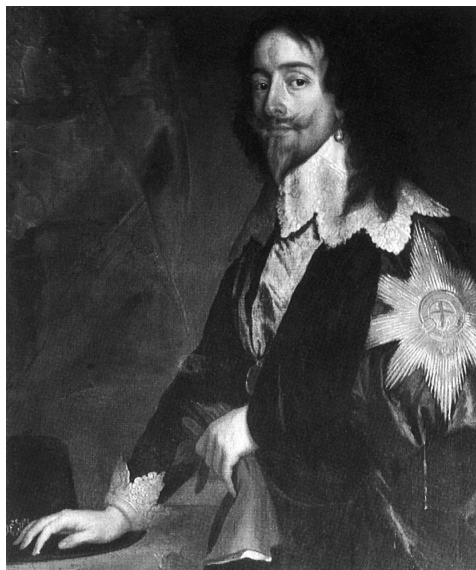
Král Karel I.

Panovníkův ukvapený krok se od počátku jevil jako velká chyba; Koruna se totiž ocitla na pokraji bankrotu. Vzhledem k tomu, že Karel I. nehodlal ukončit válku se Španělskem, musel činit zoufalá opatření, aby finanční krizi odvrátil. V mnoha ohledech se přitom jednalo o kroky, které překračovaly „hranu zákona“. Největší odpor vyvolávaly tzv. nucené půjčky (Forced Loans). V roce 1627 Karel I. ve snaze pomoci francouzským hugenotům vyhlásil válku Francii, což byl s ohledem