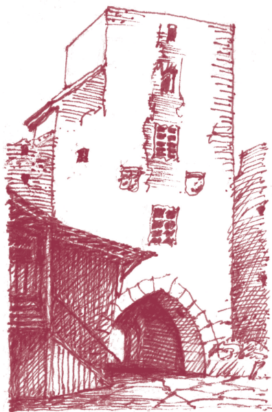
O biskupském dvoře

O několik let později biskupský dvůr nadlouho osiřel, neboť ztratil svého pána. Biskup Jan IV. z Dražic vyhnal z Prahy německé žebrařivé mnichy