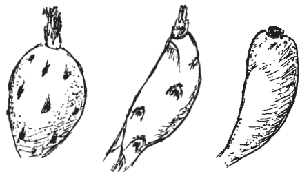
Obr. 3 Ukázka různých tvarů plodu

Pomineme-li suché pukavé plody, jaké má např. rod Turbinicarpus (u jehož zástupců se o šíření semen víceméně nikdo nestará), zjistíme, že většina ostatních plodů je uzpůsobena tak, aby sloužila jako potrava živočichům, kteří následně zajistí distribuci semen. Ne náhodou je proto řada plodů dužnatých a velmi chutných. Na jedné z našich četných zastávek v severním Mexiku jsme narazili na opuštěný polorozpadlý domek, jakých jsou v této oblasti stovky. Byl však zvláštní tím, že jeho stěny byly pokryty téměř souvislou vrstvou uschlého ptáčího trusu. Už na první pohled bylo zřejmé, že tyto pozůstatky po ptácích pocházejí z doby, kdy v okolí zraly plody kaktusu Mammillaria potsii . Jejich semena totiž v trusu dominovala, což dokazuje více než jasně pravdivost tvrzení o výhodné spolupráci rostlin a živočichů.