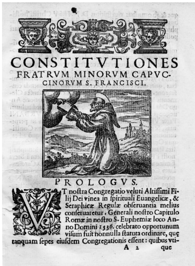
Obr. 3: Začátek předmluvy konstitucí kapucínského řádu, na níž je ztvárněn motiv, že konstituce nejsou dílem světským, ale že byly dány od Boha; Constitutiones Fratrum Minorum Sancti Francisci Capucinatorum , Romae 1638, s. 3 (KPK Praha, sign. 108 07 D).

metráž je 62,85 běžných metrů. Obsahuje celkem 175 listin, 326 rukopisů, 630 inventarizačních čísel spisového materiálu uloženého ve 450 kartonech a 83 „map“. K lepší orientaci slouží dva podrobné inventáře, které navíc obsahují detailní místní, jmenný a věcný rejstřík. 30