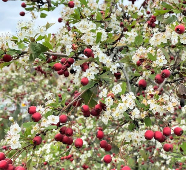
Hloh zmatený klimatem: květy a plody na keři zároveň.

Výsledkem je, že v jedné oblasti je horko a sucho a v jiných se po delší dobu vyskytují přívalové deště. Sušší je dokonce i zima, která dříve spolehlivě přinášela srážky v podobě sněhu. Celkově vzato lze ve střední a také v jižní Evropě pozorovat ve všech ročních obdobích silnou tendenci k poklesu srážek.