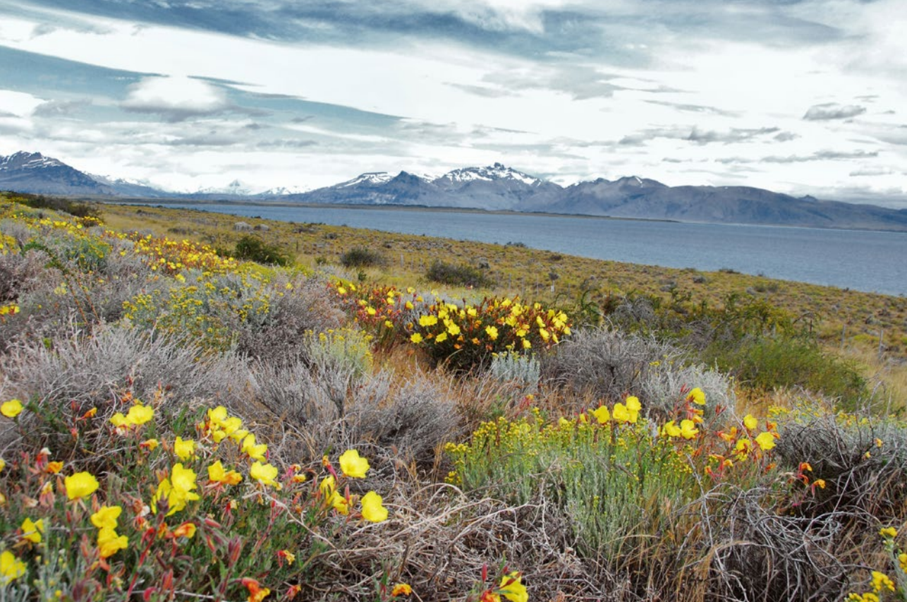
Patagonská stepní krajina na samém jihu Ameriky: rostou zde oblíbené zahradní rostliny, například pupalka dvouletá.

podzemních vod. Tyto půdy navíc obsahují velmi málo živin. Dobrým příkladem je Franská a Švábská Alba. Toto nízké vápencové středohoří je krasovou oblastí. Skály jsou protkané jeskyněmi a žlaby jako ementál dírami, povrchová voda mizí během několika hodin.