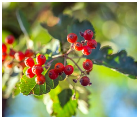
Strom budoucnosti: jeřáb muk odolný vůči horku.