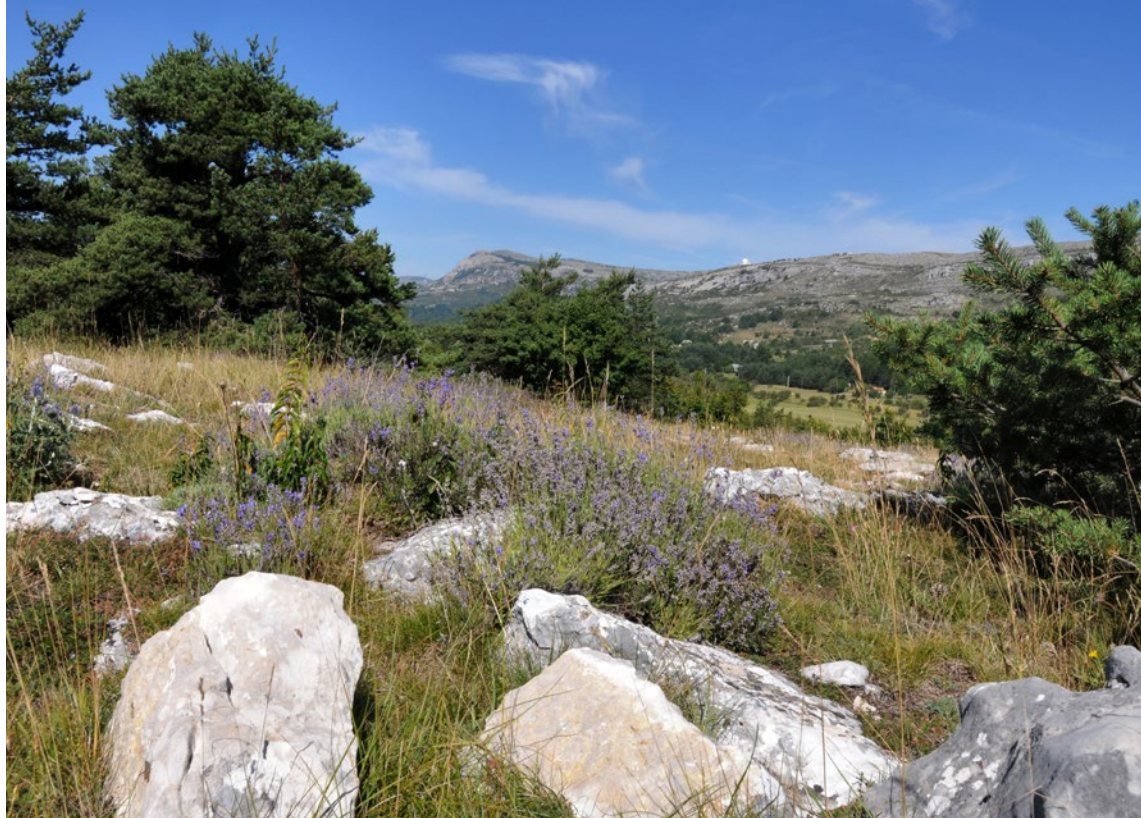
Na vápenitých, kamenitých půdách Provence kvete levandule lékařská. Ve zdejší nadmořské výšce v zimě také mrzne.

kvetoucích a odolných trvalek a travin pro suchou zahradu.