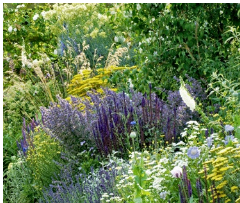
Rostlinný porost zastíní půdu.

také na jejich umístění. Rostliny přijímají vodu z půdy především kořeny, vedou ji svým tělem a vylučují ji zejména listy. Čím více listové hmoty rostlina má, čím více stromů a dalších rostlin se v oblasti nachází, tím více může docházet k odpařování. Rozsáhlé lesní oblasti, jako je amazonský deštný prales, dokonce díky značnému odpařování samy produkují vlastní srážky. V našich zeměpisných šířkách znamená transpirace především ochlazení během vegetačního období. Díky dnešní intenzivní urbanizaci narůstá počet nepropustných ploch