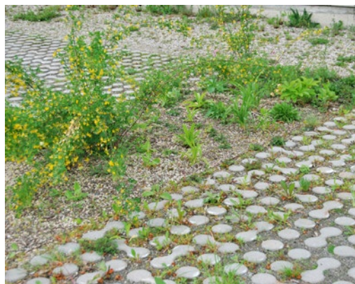
Spárová dlažba umožňuje přímé vsakování vody.

Oba druhy nádrží jsou napájeny vodou stékající z povrchu střechy budovy. Ještě před několika lety bylo zcela běžné odvádět veškerou tuto vodu přímo do kanalizace a následně do čističek odpadních vod. Dnes existují lepší řešení, jak s touto vzácnou tekutinou rozumně nakládat – nechat ji vsáknout nebo ji skladovat na vlastním pozemku. Dešťová voda prospívá rostlinám, vrací se tak také zpět do podzemních vod a je šetrnější k naší peněženice.