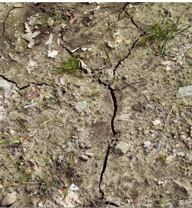
V půdě bez vegetace vznikají vlivem horka a sucha trhliny.

Počasi samozřejmě dělalo naschvály i v minulosti. Vždy se tu a tam vyskytla horká léta nebo průtrže mračen. Již několik desetiletí se však