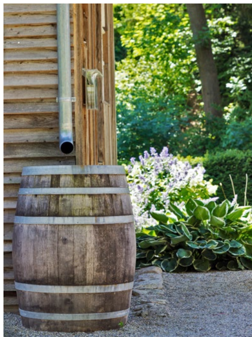
Drabocennou vodu ze střešních ploch lze snadno zachytávat do sudů.

Podzemní voda je voda, která se nachází pod zemským povrchem. Pokud se nachází ve velmi hlubokých vrstvách a vznikla před několika tisíci nebo miliony let, nazývá se fosilní voda. Tato voda je mimořádně čistá, a proto se na celém světě často čerpá z hlubokých studní. Ale její zásoby nejsou nekonečné. K doplňování podzemních vod dochází pouze tehdy, když se mohou srážky a jiná povrchová voda, například z jezer, vsakovat. Vědci odhadují, že z 22,6 milionu km 3 podzemních vod je nanejvýš 5 milionů km 3 mladších než 50 let (zdroj: Wikipedia). To ukazuje, jak dlouho trvá, než se podzemní voda doplní, a jak je důležité, aby se kvalitní srážková voda vracela do podzemních vod prostřednictvím vsakování.