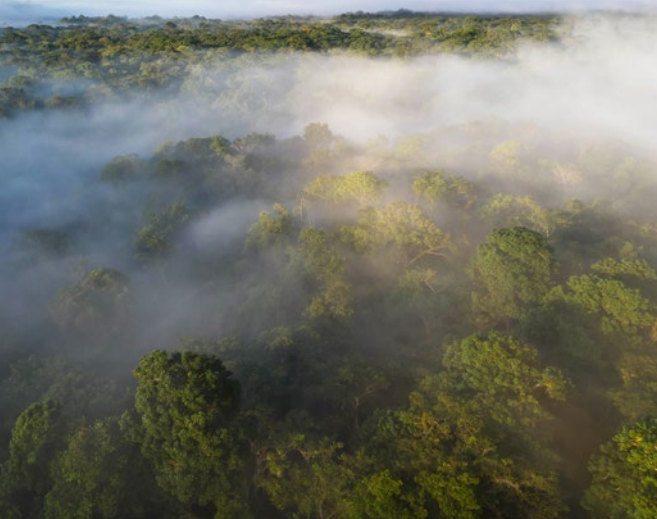
Tvorba mraků odpařováním