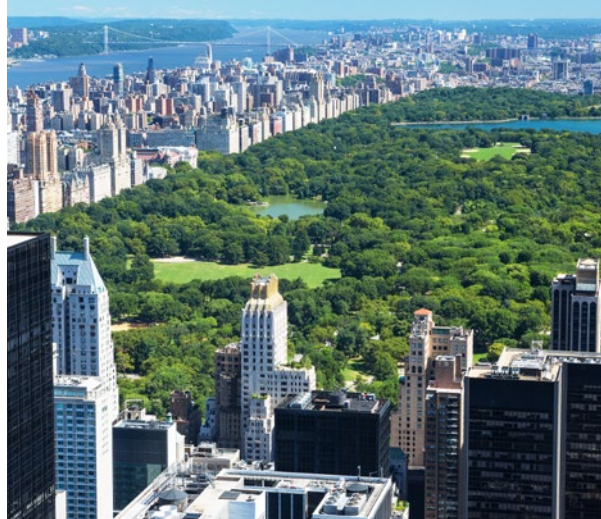
Central Park: zelené plíce New Yorku

a především ve městech v létě prudce stoupají teploty.