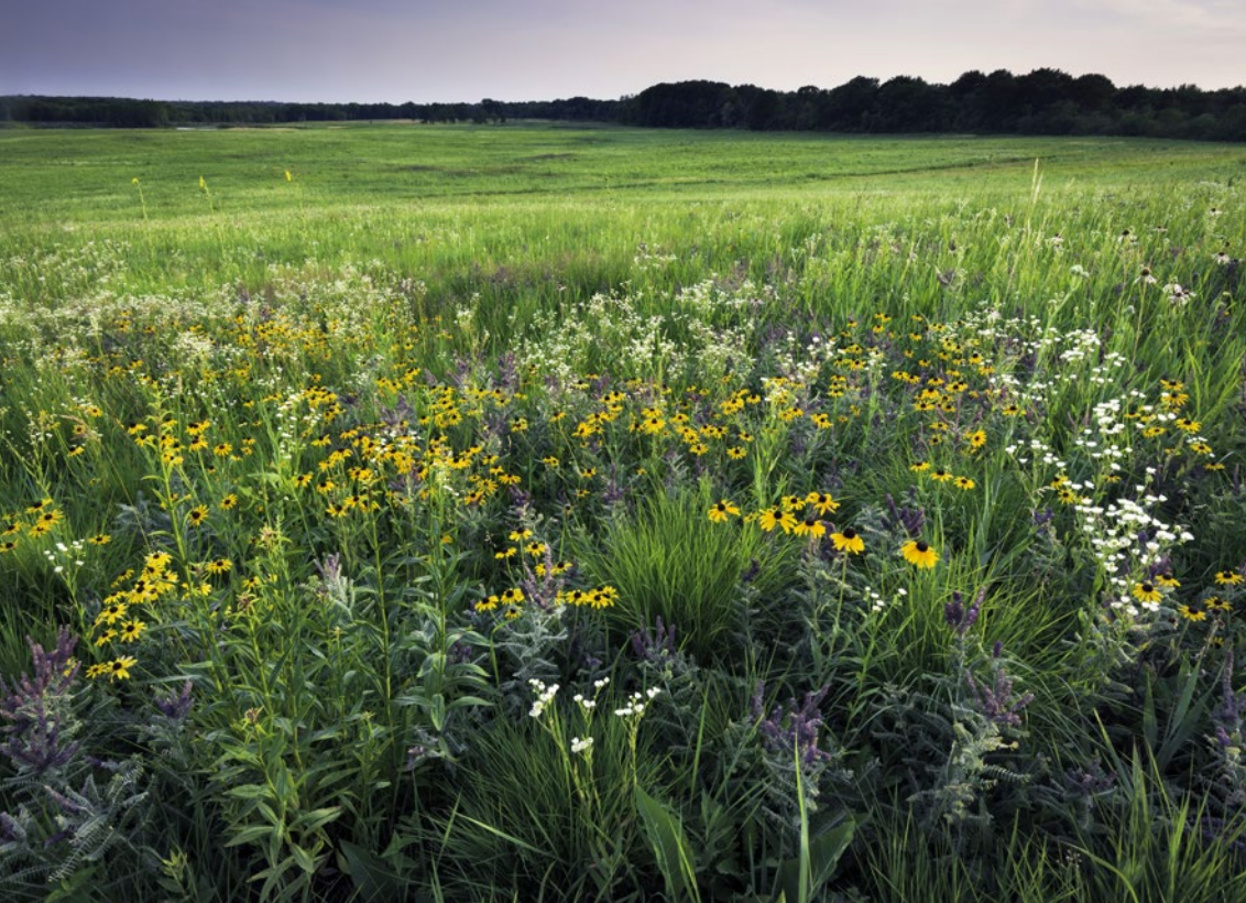
Severoamerická prémie má hluboké půdy a bývá často suchá. Rostou zde trvalky, jako jsou třapatky.

a začátkem léta, což hraje roli při jejich využití v zahradě.