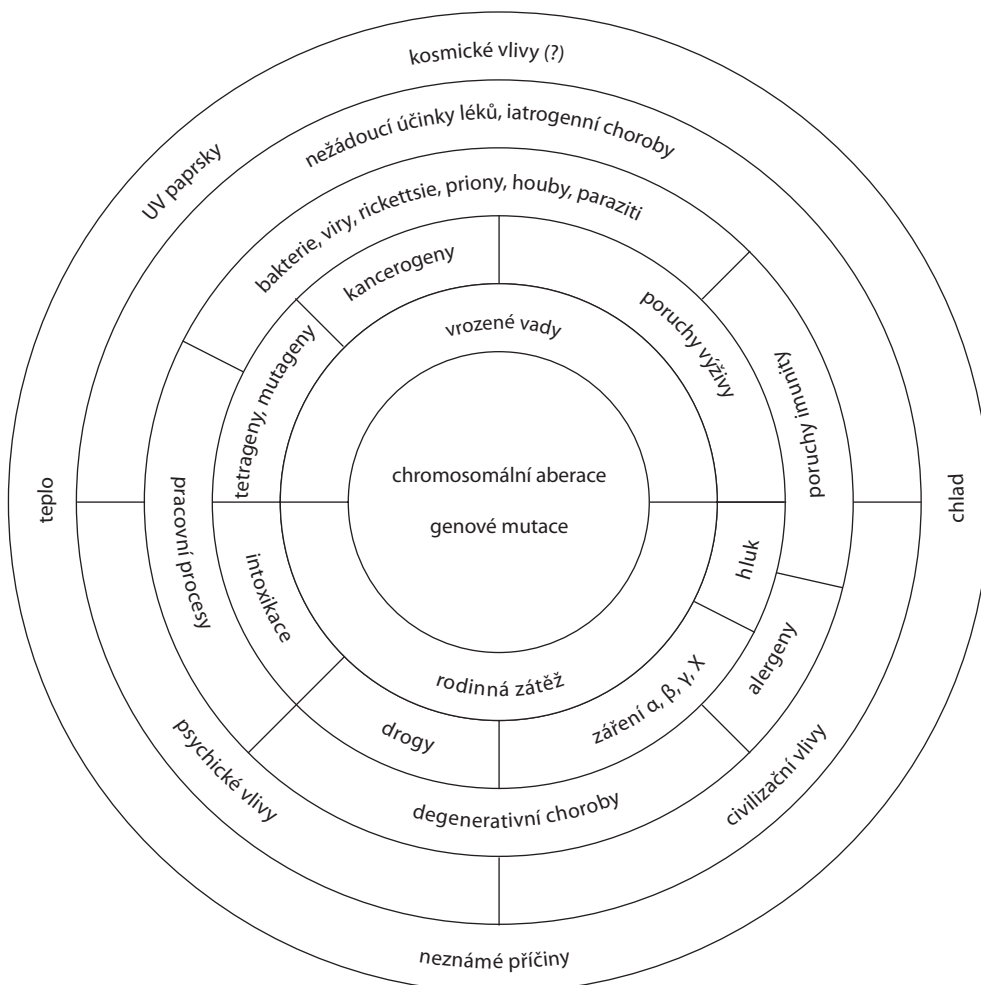
Obr. 3.1. Nejčastější příčiny interních onemocnění

Názory na příčiny nemocí se během historie vyvíjely. Pravěký člověk o příčinách nemocí a smrti zřejmě příliš neuvažoval, jasné mu byly asi jen příčiny traumat (poranění zvířetem, zbraní, ohněm). V primitivní společnosti byla onemocnění připisována působení tajemných sil nebo zlých bohů. Nemoci vstupovaly do těla jako jedovaté páry (miasmata). Proto také jejich léčení spadalo do pravomoci kmenových kouzelníků a šamanů. Později vznikající náboženství vykládala choroby jako boží trest za hříchy u dospělých, a jako trest za hříchy rodičů u malých dětí. Tento názor přetrval několik set let – od starověku do novověku. Teprve vznik a rozvoj vědních oborů (fyzika, chemie, biochemie, biologie) v renesanci spolu s racionalis-