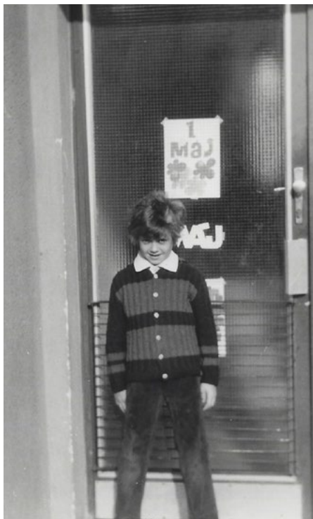
Rokycany. Kulisy dětství v ČSSR. květen 1985.