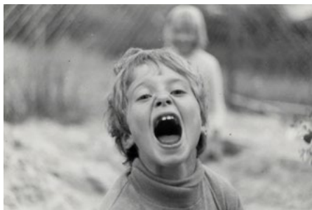
„Soudružko, já mám ale fakt tetu v Izraeli!“ polovina 80. let.

(„Sakra, soudružko! Já fakt mám pratetu v Izraeli! A můj děda má na předloktí vytetovaný číslo z Osvětimi. Proč se chováte tak divně?“)