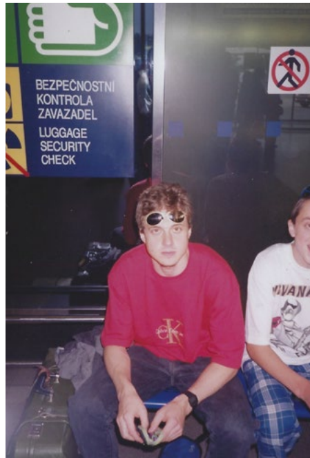
Těsně před odletem. 27. 8. 1996.

Když 10. května 1945 přijížděl Rudolf Slánský do osvobozené Prahy, patrně se považoval za ateistu, marxistu, komunistu a Čechoslováka, nikoliv za žida. Jenže i kdyby chtěl, nikdy nemohl vymazat své dětství v Nezvěsticích, atmosféru a zvyky židovské středostavovské rodiny, stejně jako vzpomínky na sionistický skautský oddíl, do kterého kdysi docházel. U generace, která dospívala po roce 1989, to bylo právě naopak. Identita ano, ale tradice skoro žádné. Jen touha teenagerů chytout se v minulosti něčeho inspirativního, udělat z rybí polívky uniformní