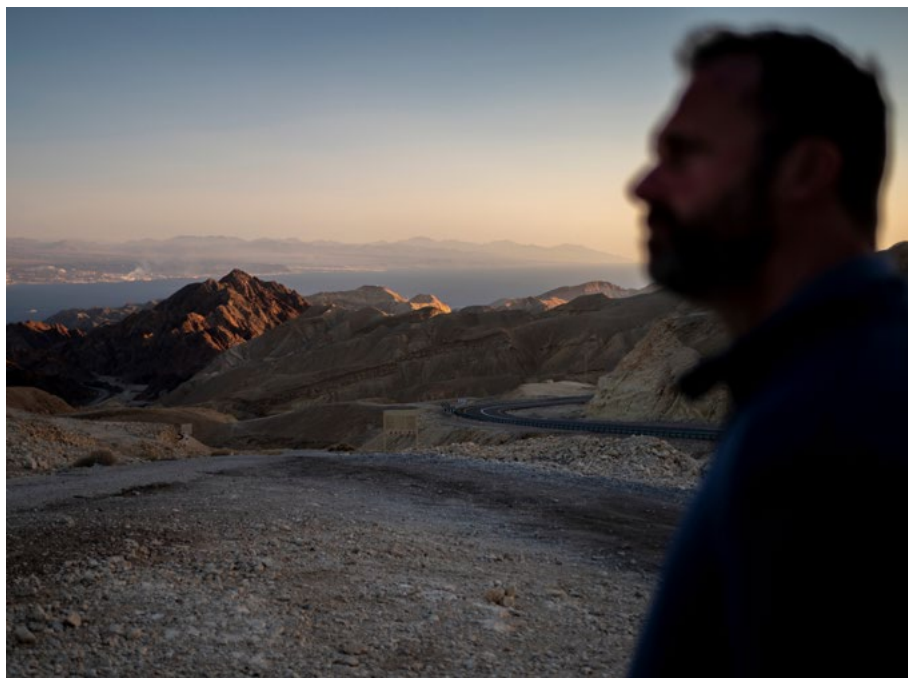
V poušti u Ejlatu.

Jo, cítím se vykořeněně, ale stejně jako v roce 1996 je to moje rozhodnutí, moje puzení a možná i řešení, jak trochu změnit kulisy svého života. Nastupuju jako zpravodaj České televize. Bude to moje objevování Izraele, dějství třetí. A tentokrát se vším všudy.