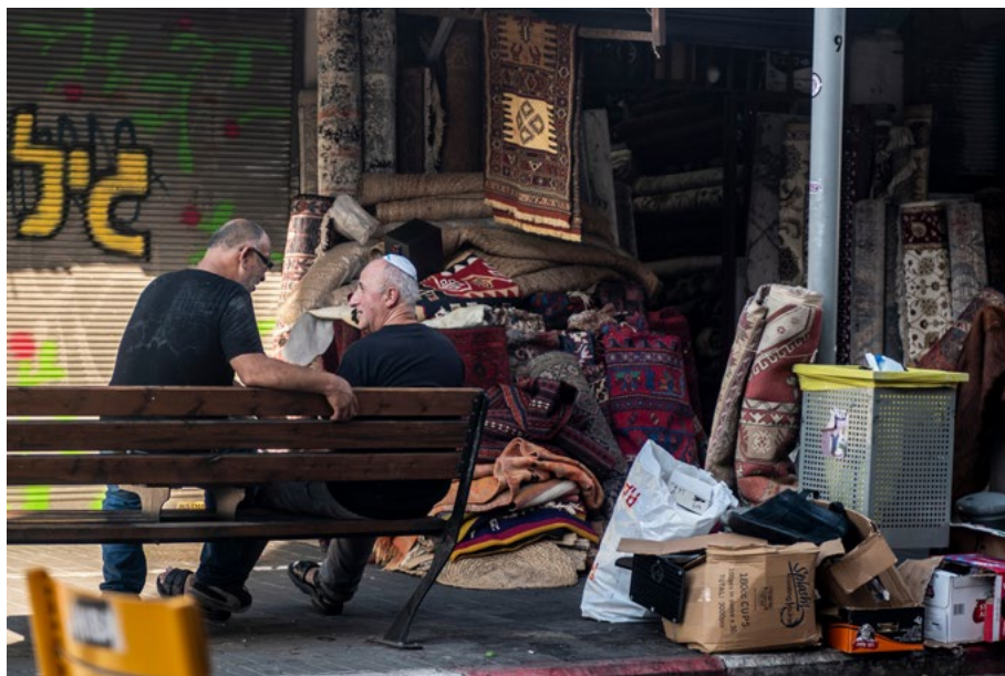
Tel Aviv-Jaffa. Momentka z tržnice.

bylo stále těžší a první roky na postu zpravodaje přinesly takovou záplavu protichůdných dojmů, že jsem přestal odpovídat. Vystačil jsem si s vytáčkou: „To máš těžký, to se takhle nedá říct.“ Teprve teď, když tu mám několik let své klíče a svoje dveře, se začaly všechny nastřádané dojmy propojovat. A coby „exulantovi“ v Orientu se mi najednou snáz odpovídá i na otázku: „Jak bys popsal Čechy a jejich mentalitu?“