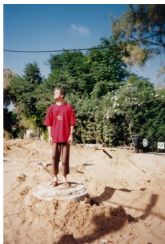
Dvě fotky, stejné místo. 1969 versus 1996.