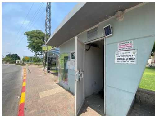
Typický objekt veřejného krytu v jižním Izraeli. Tento je ve městě Sderot a nachází se vedle autobusové zastávky. Na rozdíl od krytu, v němž jsme trávili nálet v Aškelonu, je tento uzavíratelný kovovými dveřmi.

rychle odezní. Siréna, 15 vteřin, do krytu, pak asi minutu posloucháte, jak se to všechno na nebi pere. Kdo je obezřetný, chvílku počká, dokud z oblohy nespádnou střepiny z rozstřelených palestinských raket. A je po všem. Naše náhodná skupina se rozchází.