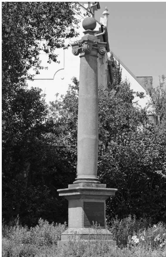
1. Praha-Troja, křižovatka ulic Trojská a Schwankova, sloup se sférou a křížem, okolo 1600, celkový pohled

Nápis na novodobé bronzové desce, osazené při jeho posledním restaurování na čelní stranu soklu, vypovídá, že tento sloup měl připomínat oběti moru z let 1568, 1582, 1585 a 1599. V těchto letech Prahu skutečně postihly morové epidemie, při té nejtěžší v roce 1585 zemřelo více než 14 000 obyvatel. 15 Je ovšem otázkou, zda byl tento sloup vztyčen právě za tímto účelem.