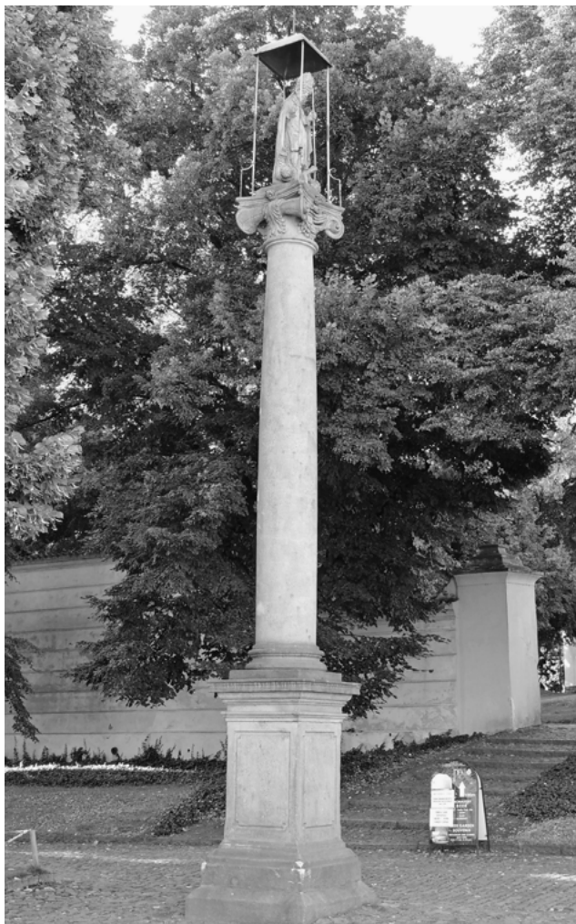
3. Praha-Hradčany, areál Strahovského kláštera, Zachariáš Bossi di Campione, sloup se sochou sv. Norberta, 1631, celkový pohled

Vybrané architektonické prvky tohoto objektu byly v rámci jeho restaurování, k němuž údajně došlo v roce 1899, zčásti nahrazeny kopiemi. V té době podle informací uváděných v dosavadní literatuře tento sloup v prostoru před klášterním kostelem Nanebevzetí Panny Marie doplnil druhý s vrcholovou sochou Ecce Homo od Čeňka Vosmíka. 25