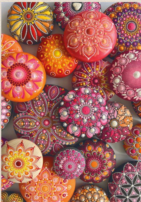
Autor: Anja Gries – @feinrosa

Já sama maluji touto technikou téměř 6 let a zaměřuji se především na malování mandal. Zpočátku jsem opravdu malovala své obrazy tvořené pouze z teček a puntíků, ale čím více jsem usedala k malování, začaly se v mých dílech objevovat také různé linky, protáhlé kapičky a další zajímavé vzory, které doplnily a obohatily každé dílo zase novým směrem. V této knize vás tedy seznámím nejen se základy malování tečkami, ale také s různorodostí této krásné a relaxační umělecké techniky.