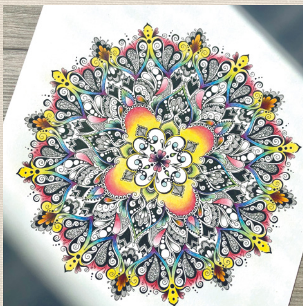
Autor: Kateřina Vančurová – @kathree_art