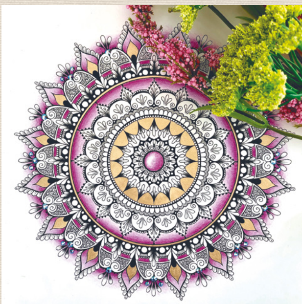
Autor: Kateřina Vančurová – @kathree_art

Ne každý člověk je schopný vytvořit okolo sebe řád a harmonii, ale většina lidí se v prostoru, kde takový řád a harmonie jsou, cítí hezky. Proto si trůfám tvrdit, že pohled na mandalu vyvolává v člověku něco příjemného. Ať už je tvořená z čehokoliv, její seskupení na nás působí pozitivně. Velmi důležité jsou také její barvy. Podobně jako si každý oblíbí jiný druh hudby, protože s ním právě tento žánr nějakým způsobem rezonuje, tak někde tam uvnitř nás existuje něco, co nám třídí barvy na oblíbené, méně oblíbené nebo dokonce nelibé. A zmiňuji to právě proto, že když člověk spatří takovýto harmonický celek v podobě mandaly, který navíc nese jeho oblíbené barvy – zastaví se. Jako by jeho duše volala: „Prosím počkej, jen chvíli postůj a dívej se, načerpám si trochu energie...“