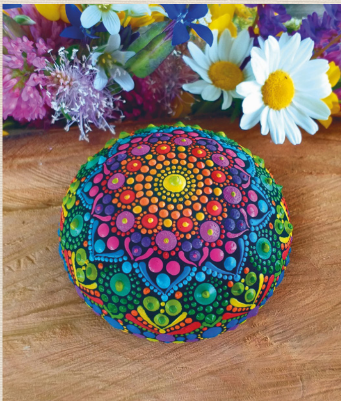
Autor: Natasha Bajić – @bohomandala.natasha