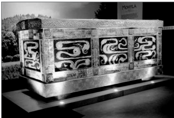
Rekonstrukce sarkofágu čínského císaře Čchin Š'chuan-ťiho, který se stal obětí elixíru života připraveného jeho alchymisty

Karel Čapek sice v divadelní hře Věc Makropulos dokazuje, že po pár stoletích může nesmrtelnost člověka omrzet, ale jeho Elina Makropulos, alchymistova třisetletá dcera toužící po smrti, je jen fikce. Naproti tomu konec pozemské existence pro nás, kteří nejsme divadelní postavy, je jistota, s níž není lehké se smířit. Nešlo to nejspíš nikdy, dá se proto