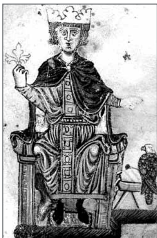
Kacířský císař Fridrich II.

papeži ale nakonec víc vadila náboženská vlačnost a tolerance na císařském trůně. A možná ještě víc požadavek prvotní chudoby církve. Roku 1245 spory vyvrcholily císařovou exkomunikací a Fridrichova moc začala postupně upadat. Zemřel roku 1250 – a odešel v něm renesanční člověk, který se nedopatřením narodil už ve středověku.