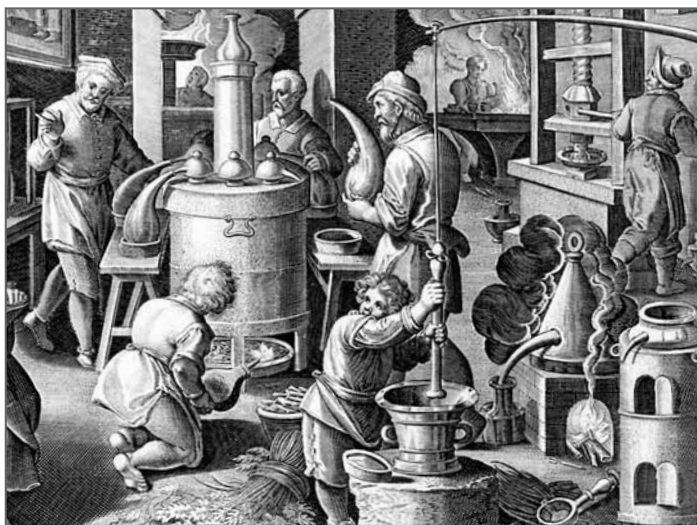
Pohled do alchymistické laboratoře v 16. století na dobové rytině

na jejich přípravu. A naopak. Dá se sice namítnout, že hermetické texty jsou natolik nesrozumitelné, že návod v nich může být zašifrovaný – ale nakonec stejně ztroskotáme na zjevné neexistenci důsledků úspěšné laborace. Jinými slovy: i kdyby tam návod byl, nikdo ho nerozluštil. Zase jsme ve slepé uličce.