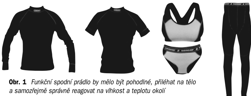
Obr. 1 Funkční spodní prádlo by mělo být pohodlné, přiléhat na tělo a samozřejmě správně reagovat na vlhkost a teplotu okolí

Podobně musí fungovat i ponožky a podkolenky. Vyrábějí se z podobných inteligentních materiálů a jsou kombinované s vlnou nebo bavlnou. Zesílení ponožek na patě a špičce, dále na chodidle a případně i na holeni, přispívá k pohodlné chůzi. Což je právě u vysokohorské turistiky velice důležité. Pozor na zašívání ponožky, mohou způsobit odřenyiny, stejně tak se chovají propocené „slané“ ponožky.