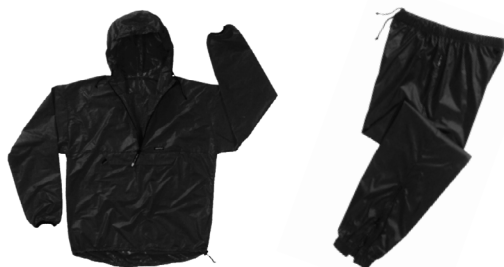
Obr. 3 Malý balíček, velká funkčnost – to je materiál Pertex

Čtvrtá vrstva chrání před větrem . Oblékáme ji na předchozí tři, proto musí být dostatečně volná. Využijeme zde i obyčejnou šustákovou bundu (ta však blokuje trasportní funkce předchozích vrstev), z novějších materiálů pak Pertex nebo Tactel. Větrovky z těchto materiálů se dají sbalit do miniaturního balíčku. Vítr – v závislosti na rychlosti – může snižovat vnímanou teplotu až o desítky stupňů (viz tab. Efekt chlazení větrem ). Vítr odebírá teplo, které si tělo vytvoří, a tím je ochlazuje. Úkolem čtvrté vrstvy proto je zabránit větru, aby pronikl k tělu, zároveň však musí být v souladu s vrstvami předchozími, tedy musí dovolit potu a páře volně odcházet. Výhodou „větrovek“, které tyto požadavky dokonale plní, je lehkost a výjimečná sbalitelnost. Oceníme je při toukách přírodou, při běhání i při cyklistice.