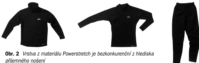
Obr. 2 Vrstva z materiálu Powerstretch je bezkonkurenční z hlediska příjemného nošení

V běžných podmínkách se nehodí chodit jen ve spodním prádle a ve třetí vrstvě oblečení by nám někdy mohlo být příliš velké teplo. Proto je tu právě druhá „civilní“ vrstva. Díky ní můžeme plynule reagovat na mírné změny teploty okolního prostředí.