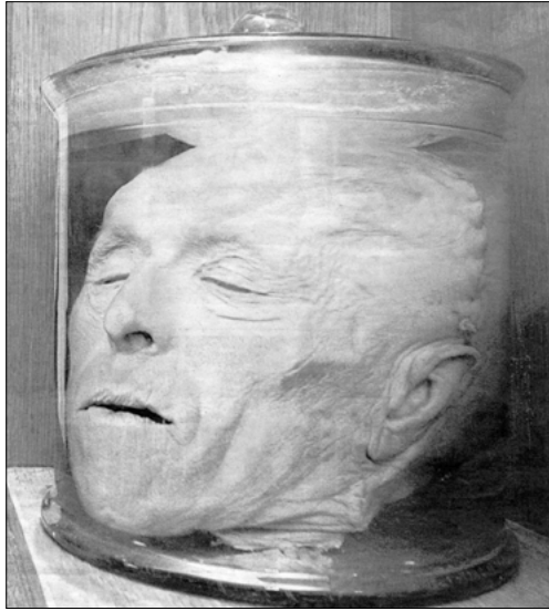
Hlava masového vraha patří nově mezi rarity pražského Muzea Policie ČR.