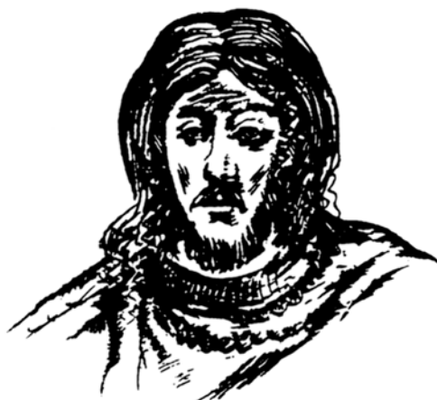
Obr. 1 Údajný portrét knížete Oldřicha podle fresky ve znojenské rotundě. Převzato z literatury [4]

První historicky doložené informace o sjednocení daňové politiky, tedy o vytvoření jakéhosi předchůdce pozdějšího katastru, pocházejí z roku 1022. V jedenáctém roce své vlády zavedl kníže Oldřich vybírání daně z polností – araturu. Technickou jednotku stanovující velikost daněné plochy tvořil lán , což představovalo plochu o velikosti dnešních asi 18 hektarů. Velikost usedlosti se tedy vyjadřovala v lánech a jeho zlomcích, ale počet lánů vycházel z přiznaných odhadů, takže cel-