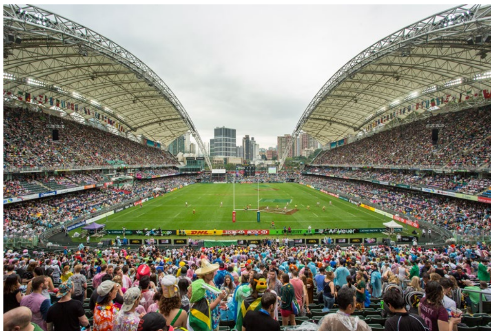
Obrázek 4 Atmosféra ragbyového utkání

Anglická Premiership a francouzská Top14 jsou si podobné, protože staví na tradičních klubech z ekonomicky silných oblastí. Irsko, Wales, Skotsko, Itálie a nově Jižní