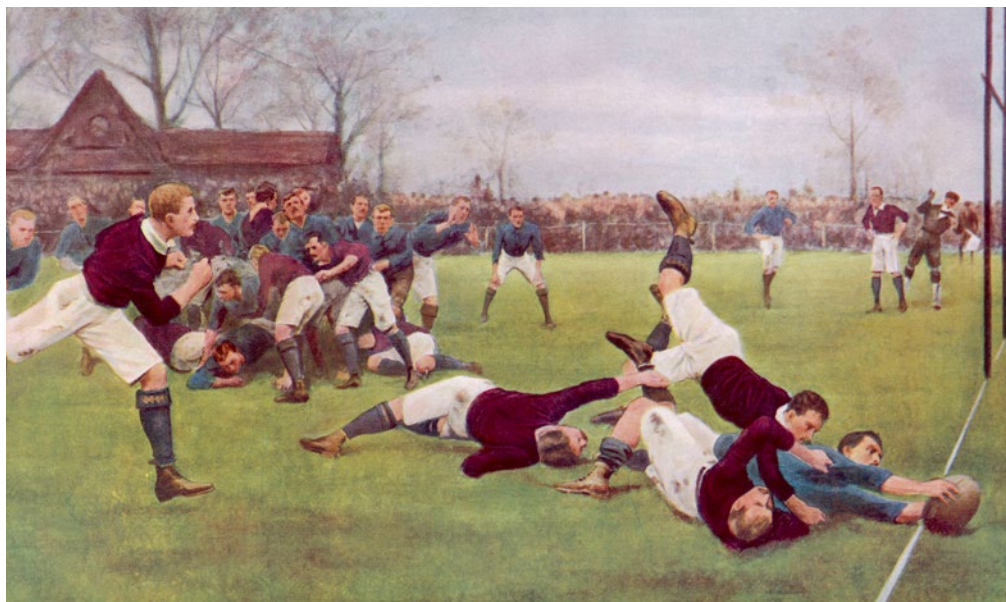
Obrázek 2 Historie ragby – malba zachycuje „položení“ v roce 1897