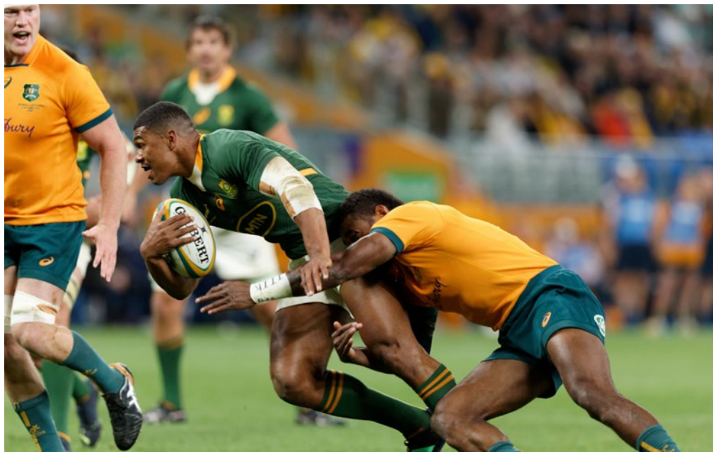
Obrázek 3 The Rugby Championship – utkání mezi Jižní Afrikou a Austrálií

Národní patnáctkové týmy jednotlivých zemí jsou zapojeny v několika významných turnajích. Six Nations je tradičním turnajem nejlepších evropských ragbyových zemí, který se hraje jednokolově během února a března. The Rugby Championship je