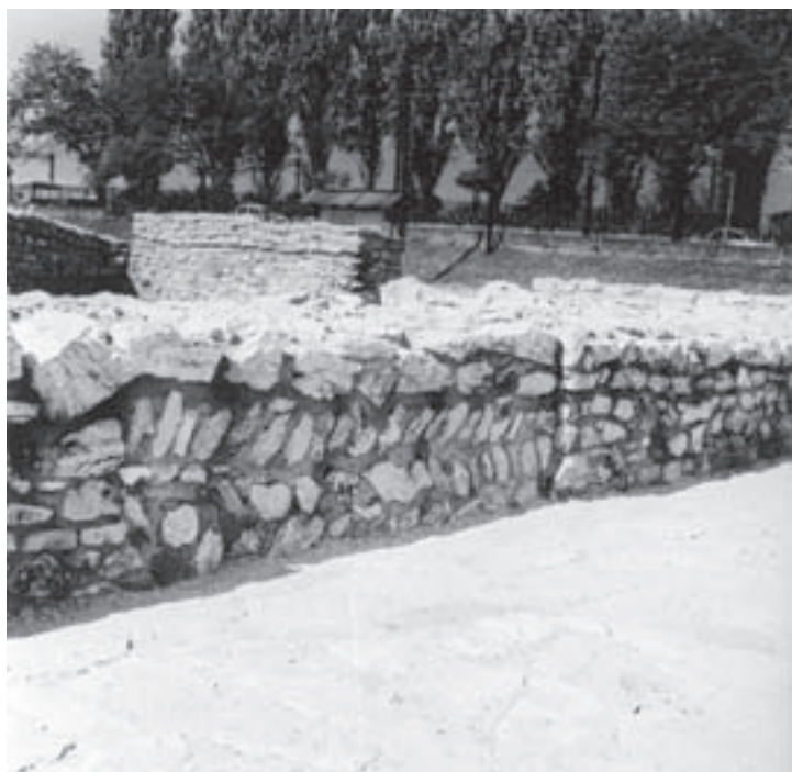
Obr. 2.1 „Opus spicatum“, zbytky římských staveb (Aquincum, Budapešť)