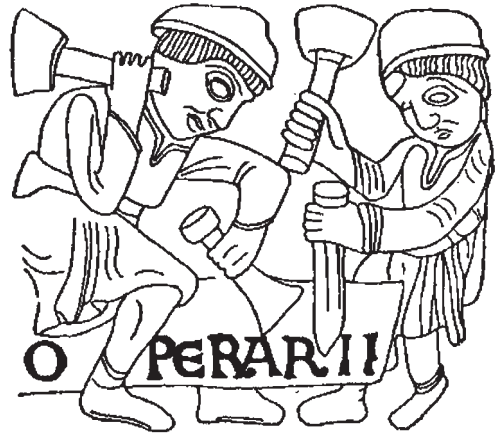
Obr. 2.3 Opracovávání kvádrů pomocí špičáku a plochého (šarírovacího) dřeva (románský reliéf z Maastrichtu 1180)

Kvalitě omítek se také napomáhalo velmi pečlivým hašením vápna. Empirickými zkušenostmi se přišlo na to, že kvalitu vápna ovlivňuje přímo při výhasu přítomnost látek s povrchově aktivním účinkem, ponejvíce roztoků s obsahem alkoholu nebo zmýdelnitelných tuků. Ty totiž usnadnily dokonalé prohašení vápenné kaše až do nejmenších částic a bránily vytváření koloidních agregací nebo i větších spečených a neprohašených kongregací. Proto se při hašení vápna přidávalo pivo, víno, jablečný mošt, ale také lůj či jiné organické tuky. Protože každý technologický proces byl ve středověku přísně chráněným tajemstvím a v Byzanci to platilo dvojnásob, byly tyto postupy proměněny v rituál, v němž se původní praktický účel již nedal vysledovat. Některé dosti kuriózní postupy se dlouho tradovaly, např. obřad, při kterém se do jámy s vápnem házela mrtvá zvířata, zejména kočky. Postup hašení rozeznával několik variant a to z hlediska účelu, na které mělo být vápno použito. Na příklad uhličitanové vápno, vhodné pro vnější omítky se připravovalo tak, že se vyhašené vápno shrabalo do kupek, ty se přikryly kravskými nebo ovčími kůžemi a nechalo přes zimu vymrznout. Vápno se jednak působením vzdušného oxidu uhličitého na povrchu částečně přeměnilo na uhličitan vápenatý, jednak se mrazem opět rozrušily přítomné kongrece. Takto upravené vápno se