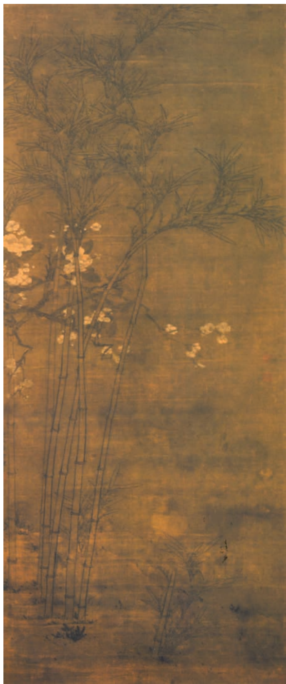
◀ Bambusy a slivoň, polovina 16. století, malíř Ťin Š'. Z knihy Bambusy od Lubora Hájka