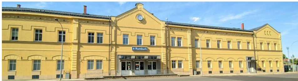
Nádražní budova v Rumburku.

Rychlíková linka s označením R22 spojuje Kolín, lázeňské Poděbrady, Nymburk, Mladou Boleslav, Bakov nad Jizerou, Bělou pod Bezdězem, brány do Máchova kraje Bezděz, Doksy, Staré Splavy až do České Lípy nebo sklářského Nového Boru. Dál jede rychlíková linka krajinou CHKO Lužické Hory přes Jedlovou, Rybníště, Krásnou Lípu až do hraničního Rumburku nebo Šluknova. V základní trase Kolín – Mladá Boleslav – Nový Bor jede rychlík od rána do večera každé dvě hodiny.