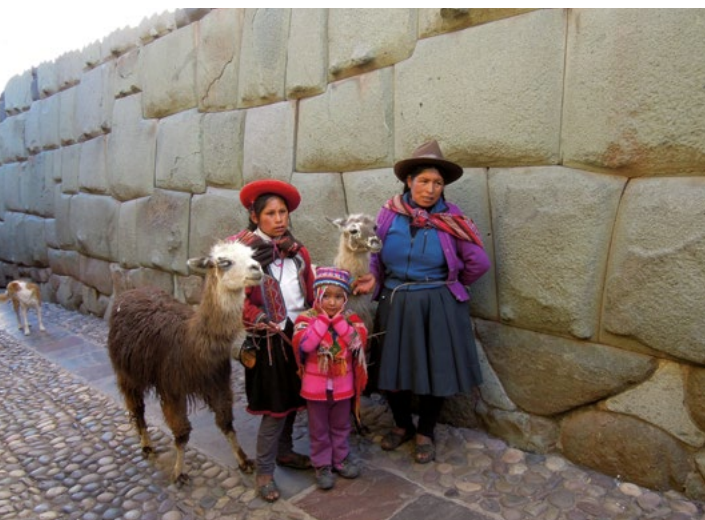
Pozůstatky zdi paláce Inky Rocy