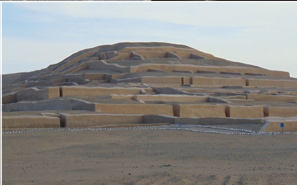
Velká pyramida v Cahuachi, hlavním ceremoniálním centru Nasků