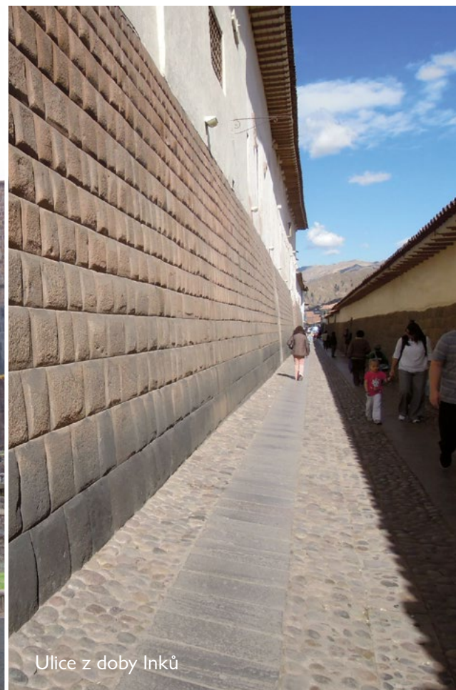
Ulice z doby Inků