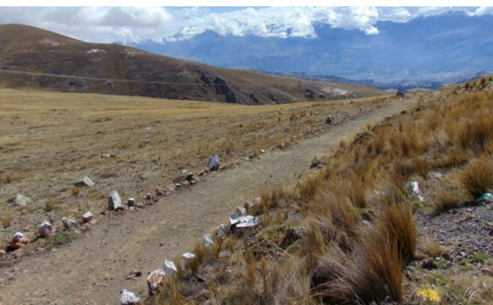
Incká cesta vedoucí z pobřeží přes Černou kordilieru

zdobené zlatem, stříbrem a drahými kameny, mělo administrativní budovy a školy. Žilo zde podle nejrůznějších odhadů mezi sto padesáti a třemi sty tisíci obyvateli.