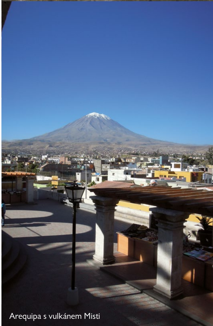
Arequipa s vulkánem Misti