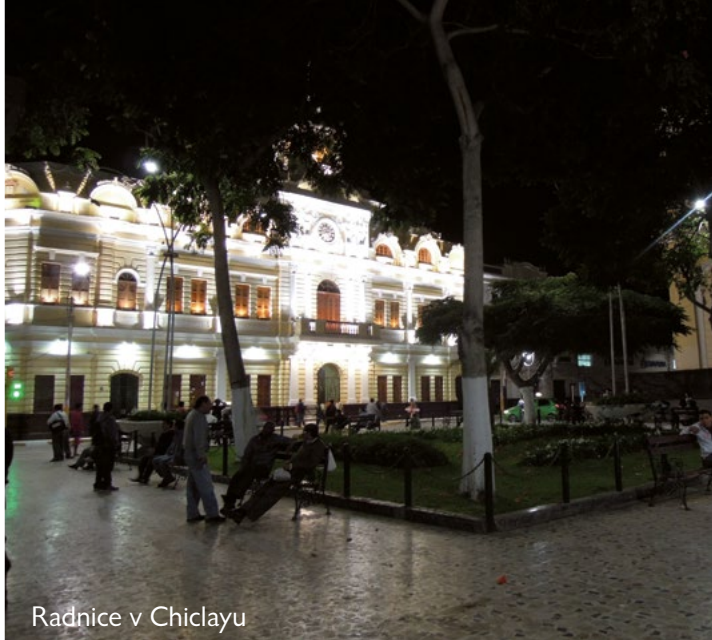
Radnice v Chiclayu