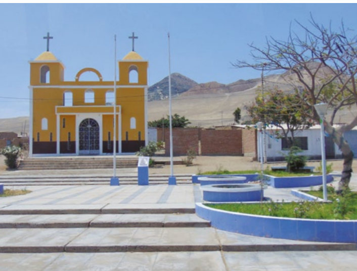
Náves ve vesničce na severním pobřeží

daří hlavně zdejší odrůdě broskví, hruškám a kapulí ( Prunus salicifolia ), což je jakýsi druh třešně. A i když je to pro Evropana možná dost těžké pochopit, v údolí pod Huascaránem, i ve výšce nad dva tisíce metrů, jsou pomerančové plantáže!