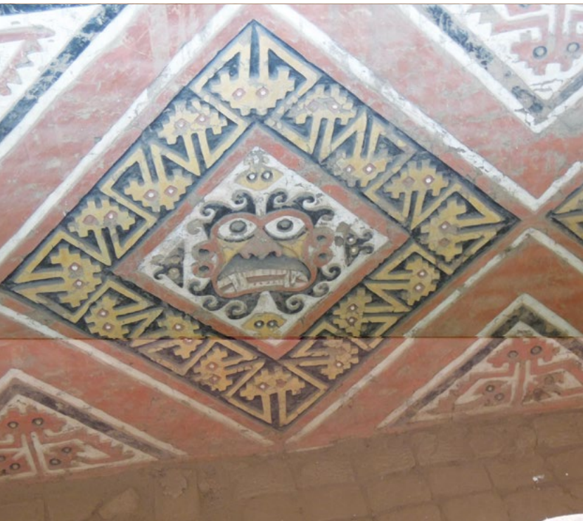
Mochické pyramidy byly zdobeny malbami či vlasy. Pyramida Měsíce. Démon s vystupujícím obočím