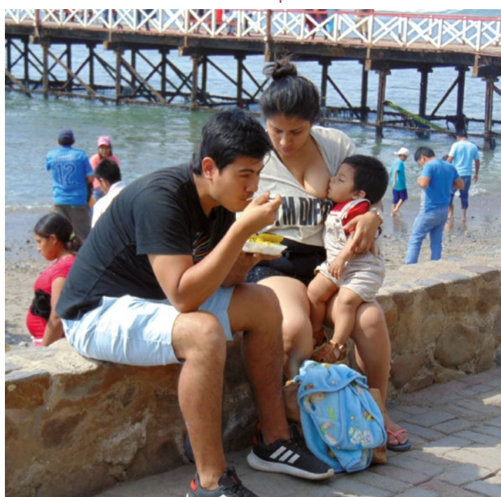
Mladá mestická rodina na nedělní procházce

Další početnou skupinou jsou indiáni. Sem zahrnujeme nejenom ty tzv. „čistokrevné“, kterých je velmi málo, jenom asi 5 %, ale počítáme k nim všechny obyvatele, u nichž převažuje indiánská krev. Ti pak tvoří asi 33 % veškerého obyvatelstva. Nejpočetnější skupinu tvoří andštití indiáni národa Quechuů a Aymarů. K nim musíme ještě