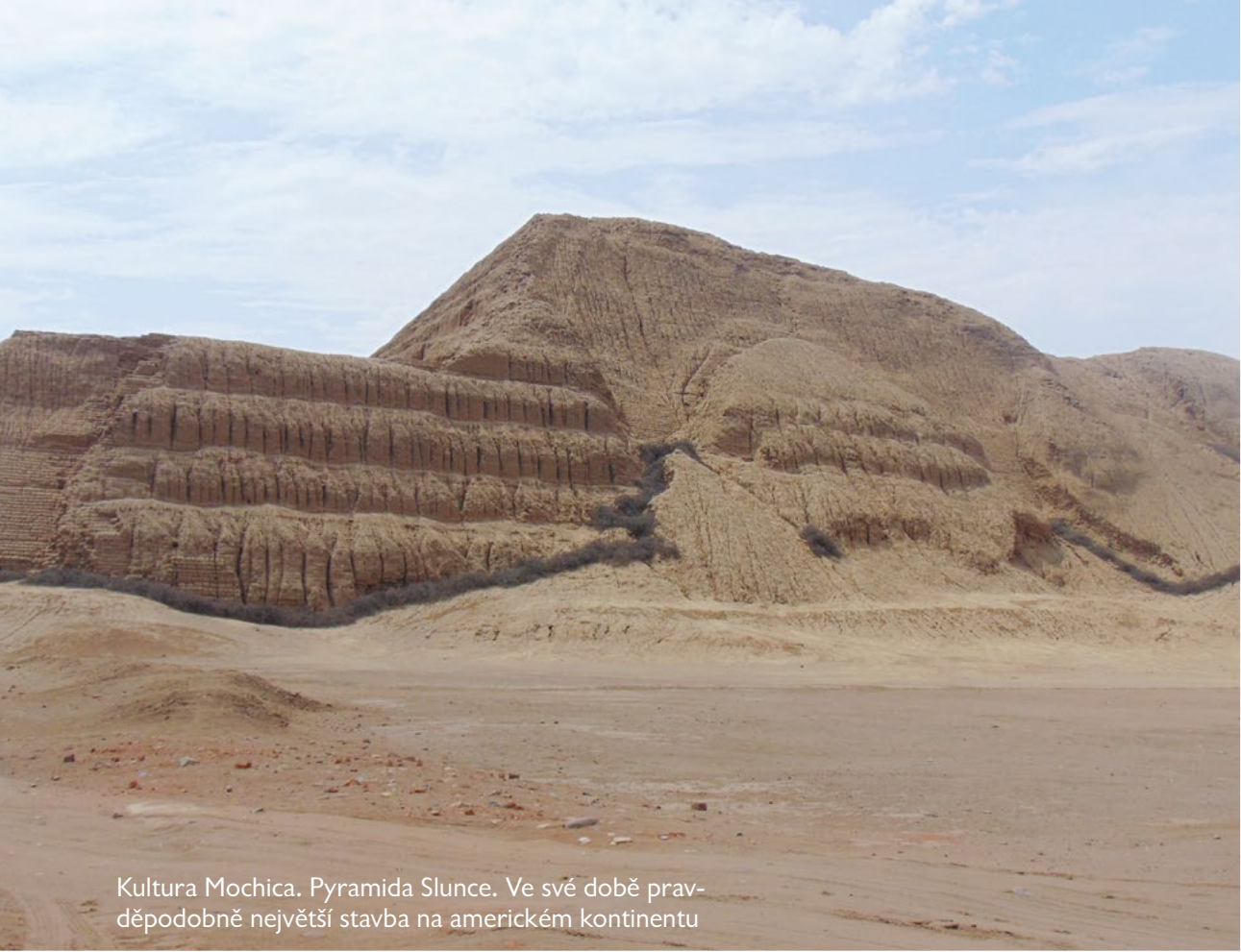
Kultura Mochica. Pyramida Slunce. Ve své době pravděpodobně největší stavba na americkém kontinentu