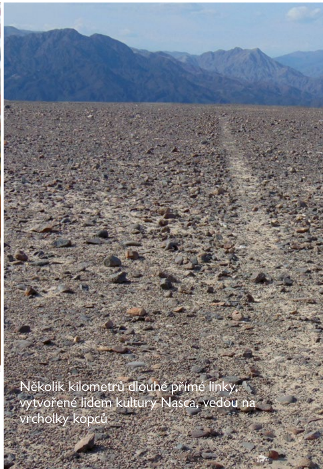
Několik kilometrů dlouhé přímé linky, vytvořené lidem kultury Nasca, vedou na vrcholky kopců