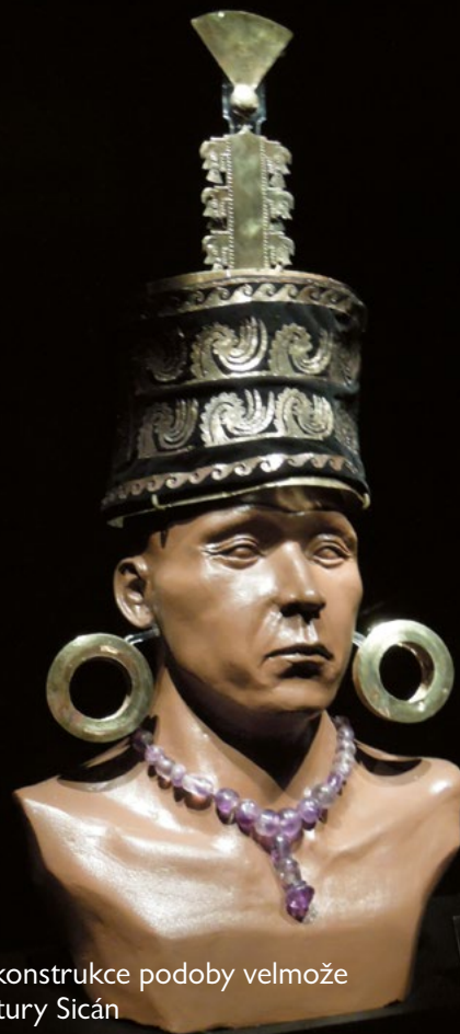
Rekonstrukce podoby velmože kultury Sicán