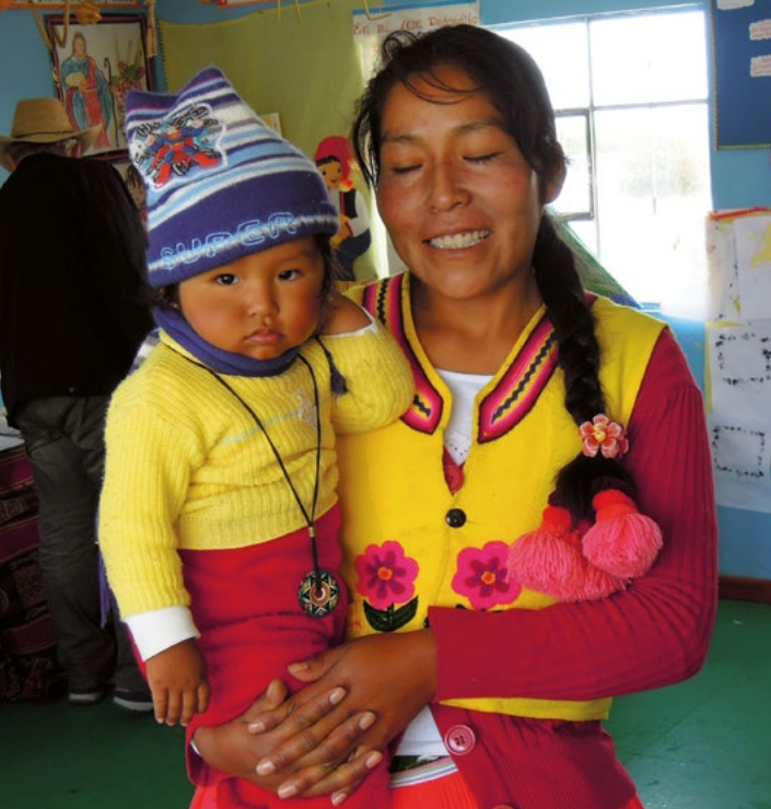
Aymarská matka s dítětem