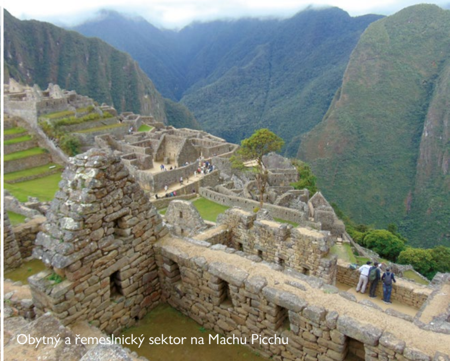
Obytný a řemeslnický sektor na Machu Picchu