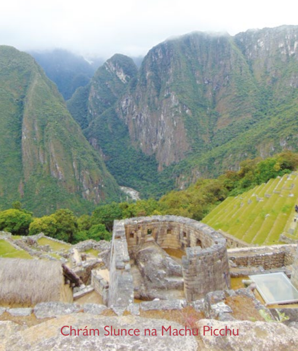
Chrám Slunce na Machu Picchu