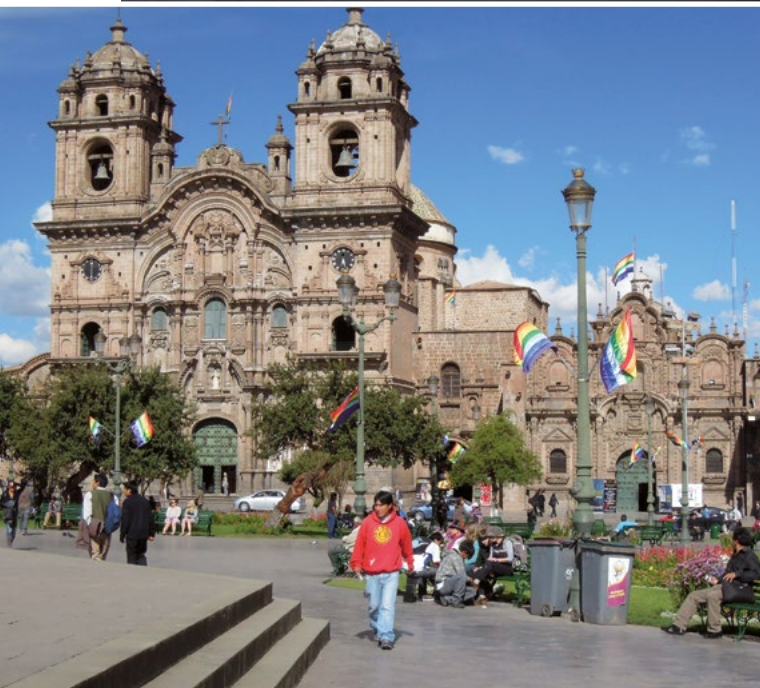
Cusco. Hlavní náměstí s jezuitským chrámem a starou univerzitou San Antonio Abad