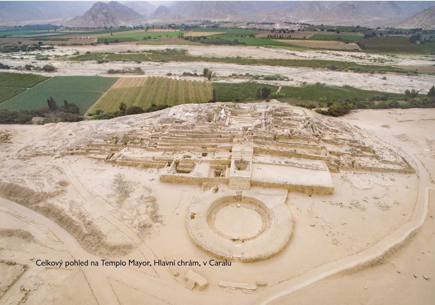
Celkový pohled na Templo Mayor, Hlavní chrám, v Caralu