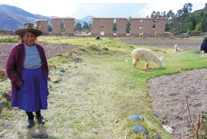
Zachovaná část incké cesty z Cusca na jih k jezeru Titicaca