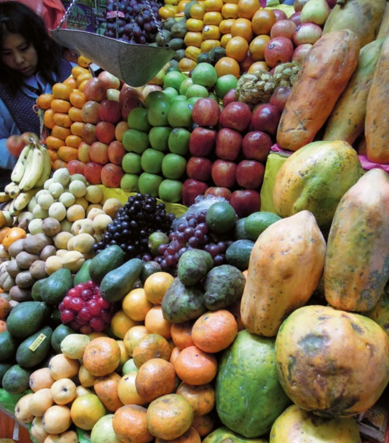
Na každém trhu se prodává mnoho ovoce