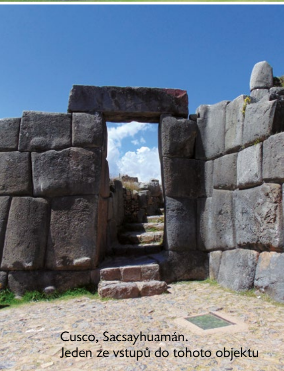
Cusco, Sacsayhuamán. Jeden ze vstupů do tohoto objektu