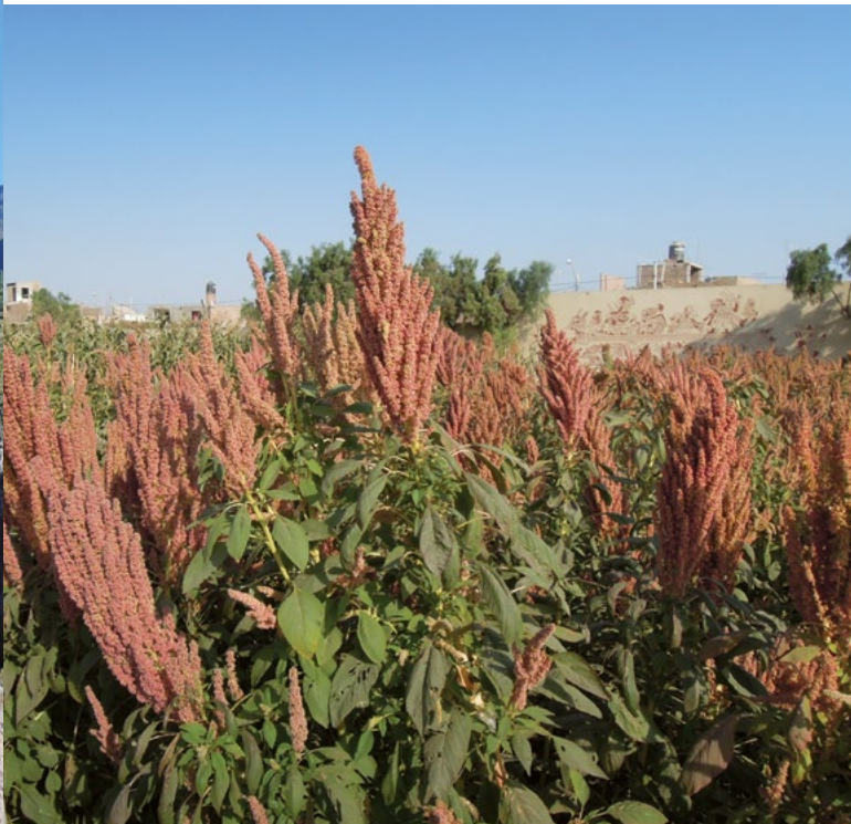
Pole se zrající kiwichou