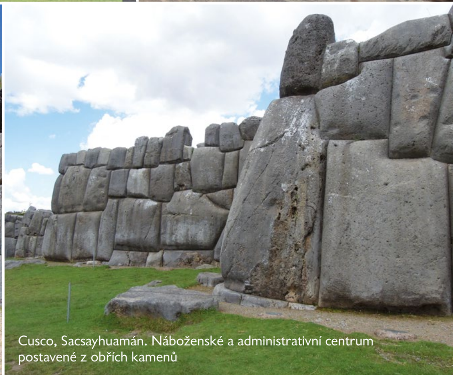
Cusco, Sacsayhuamán. Náboženské a administrativní centrum postavené z obřích kamenů