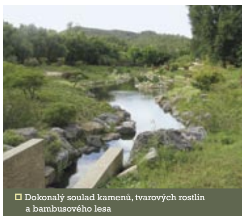
□ Dokonalý soulad kamenů, tvarových rostlin a bambusového lesa

Čína představovala unikátní prostředí pro vývoj zahradního umění a velmi silně ovlivnila tvorbu zahrad nejen v Japonsku, ale také v evropských zemích.