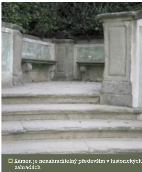
□ Kámen je nenahraditelný především v historických zahradách

bí se začínají stavět umělé jeskyně – grotty. Kámen byl dále používán ke stavbě nádrží, kašen a pro zhotovení váz a nádob. Typické pro toto období je použití důmyslných mechanismů pro vytvoření vodních efektů v zahradních kompozicích.